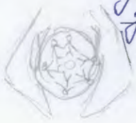
- схема эмблемы

Девизом фестиваля я бы выбрала фразу: «Каждый ребенок имеет право на речетов». Эмблема эмблемой бы сшита из рыва и вышита бы следующим образом: Руки, сплетенные ладонями, держали бы голубой круг - это символизирует заботу, равенство и единство, а также цвет круга - синий - символизирует небо. В кругу можно расположить изображения улыбающихся детей разных национальностей, в центре орбита, которая стоит в кругу и держится за руки - это также означает, что любой ребенок нуждается в заботе и любви.