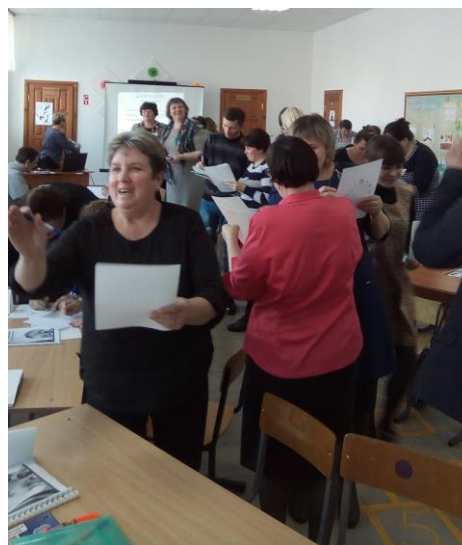
Использования структуры КЛОК БАДДИС (время)