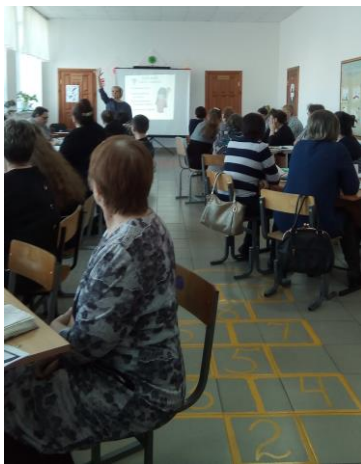
Приём ВАЙ ФАЙ (внимание)