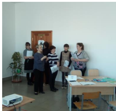
Применение структуры КОНЭРС (углы)