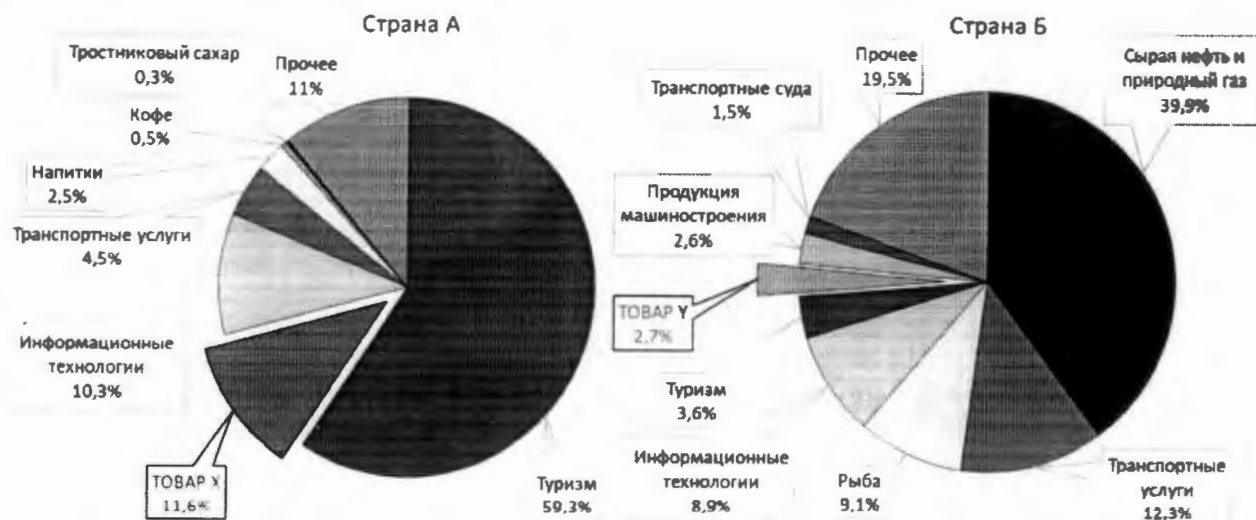
Структура экспорта стран, 2017 г.

Задача 4. На рисунке представлена структура экспорта двух зарубежных стран, задействованных в глобальной цепочке добавленной стоимости одной из отраслей промышленности, которая включает в себя различные звенья. Продукция этой отрасли используется в автомобильной, авиационной, электротехнической, пищевой и других отраслях промышленности.