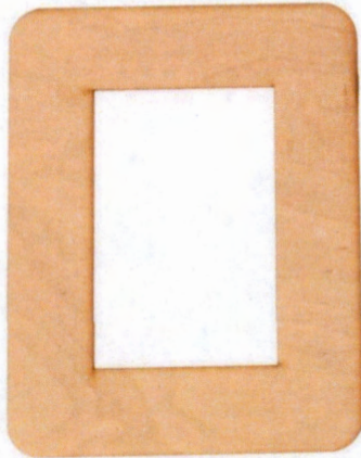
Рис. 1. Образец фоторамки

высокий и узкий рисунок узоров 1 Примечание. Учитывается вид декоративной отделки и дизайн готового изделия.