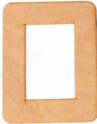
Рис. 1. Образец фоторамки

Примечание. Учитывается вид декоративной отделки и дизайн готового изделия.