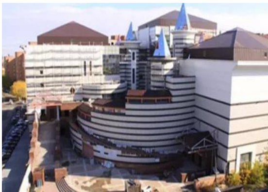
Музейный комплекс им. И.Я. Словцова