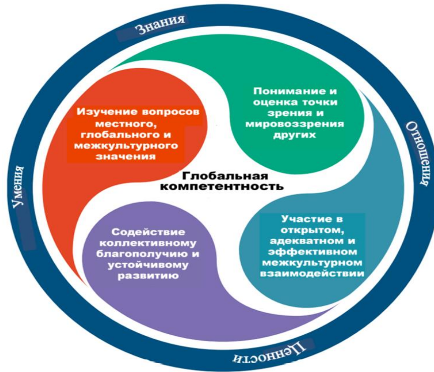
Рис. 1. Концептуальная модель оценки глобальных компетенций