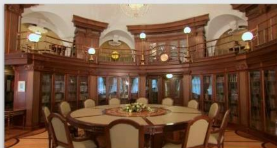
ЛИЧНАЯ БИБЛИОТЕКА ПРЕЗИДЕНТА