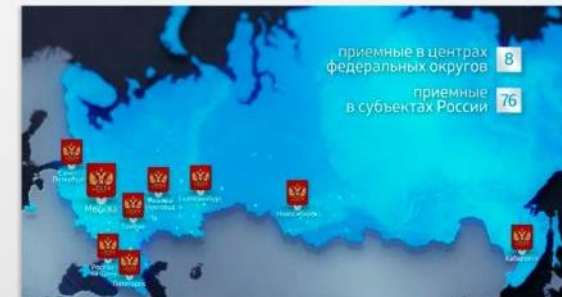
ОБРАЩАЮСЬ К ПРЕЗИДЕНТУ