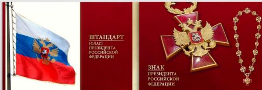
СИМВОЛЫ ПРЕЗИДЕНТСКОЙ ВЛАСТИ