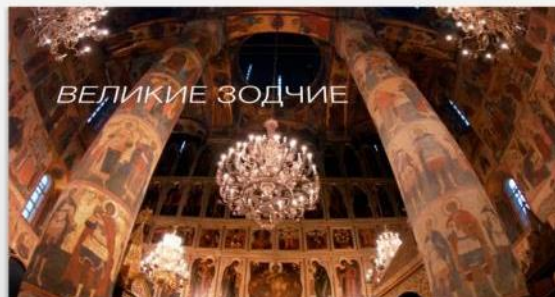
ПАРАДНАЯ РЕЗИДЕНЦИЯ ПРЕЗИДЕНТА