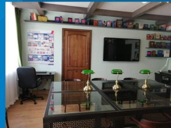
В библиотеке г.Талица