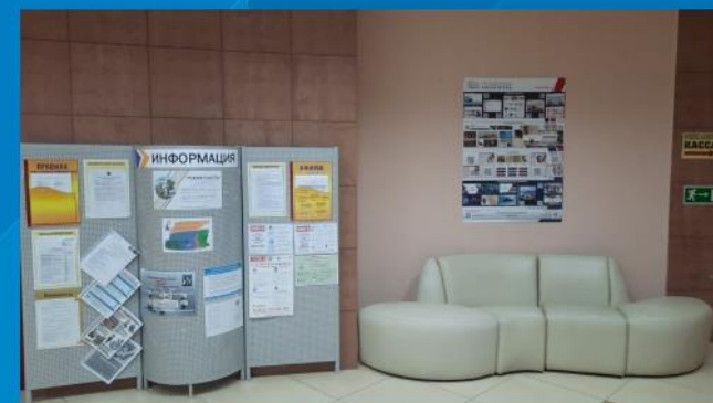
В библиотеке г.Нефтеюганск