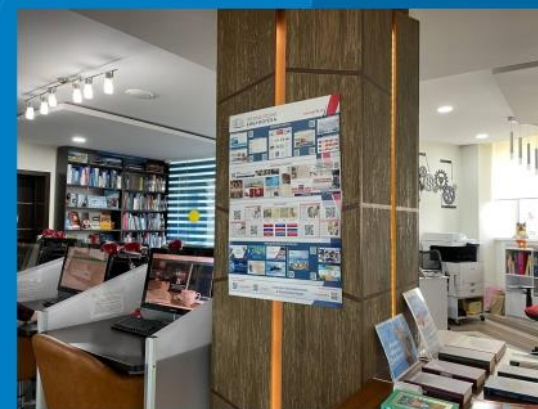
В библиотеке г.Салехард