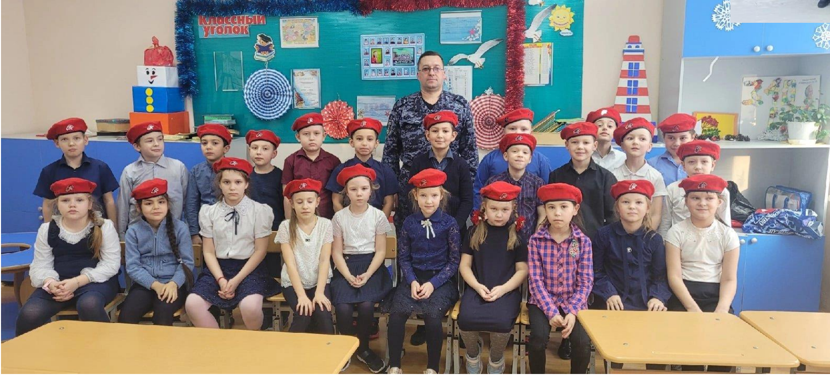
Акции « Красный тюльпан», «Блокадный хлеб», «872 дня»