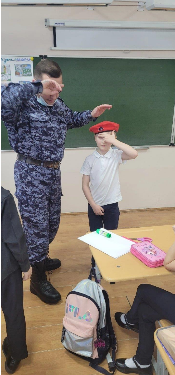
Торжественное посвящение в Юнармейцы заместителем главы по социальным вопросам и военкомом Уватского района .