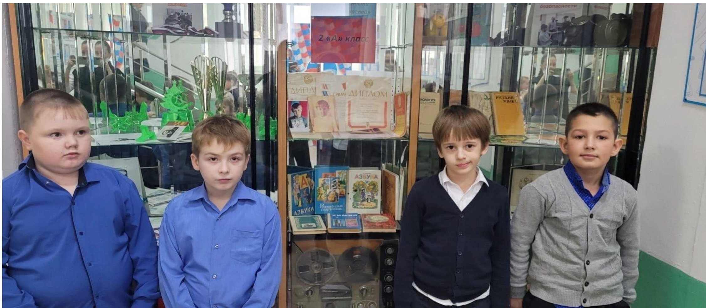
Выставка «Школьные принадлежности моих родителей»