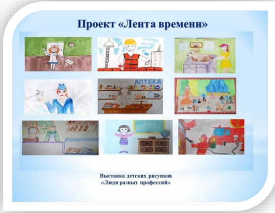
Выставка детских рисунков «Люди разных профессий»