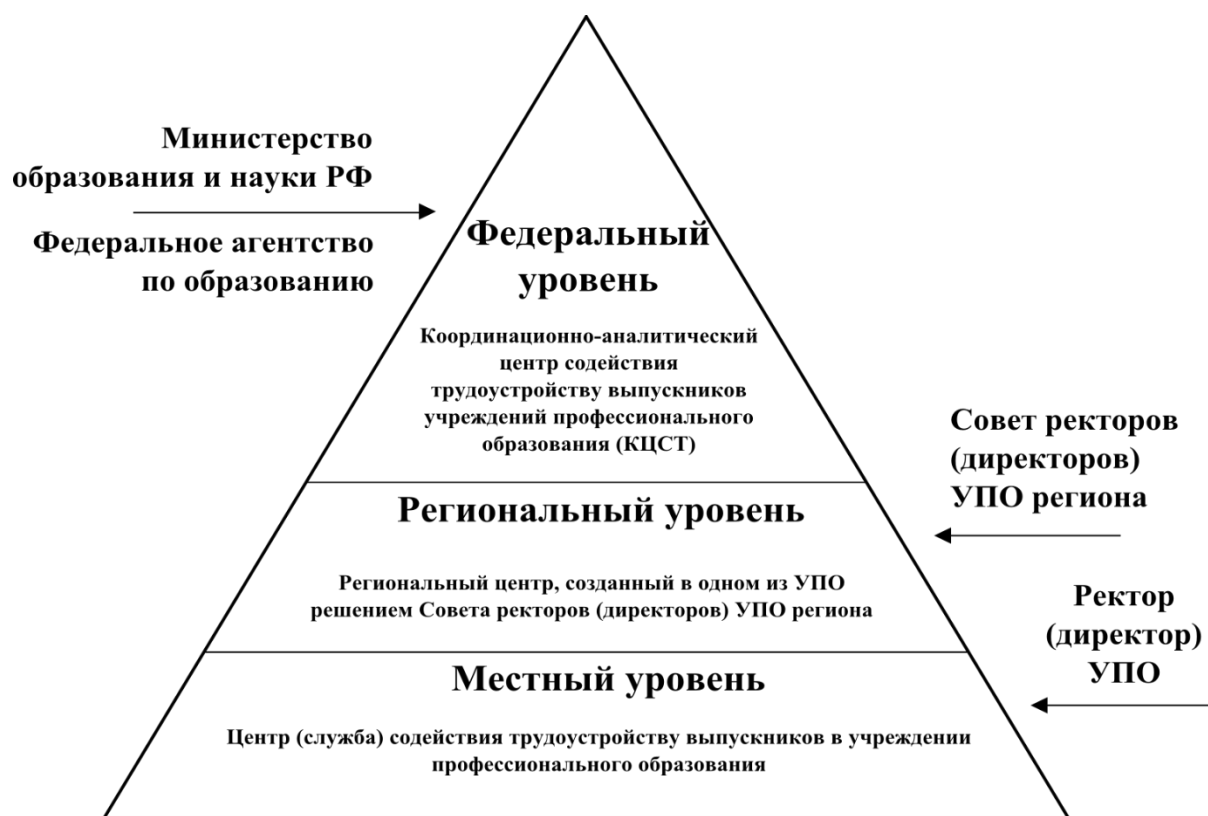
Рисунок 1 – Структура ССТВ

Деятельность центра (службы), создаваемого в учреждении профессионального образования, состоит из четырех групп задач: