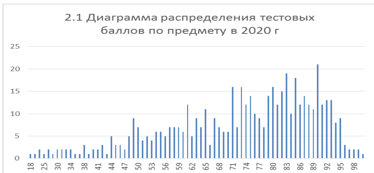
Рисунок 1. Диаграмма распределения тестовых баллов по английскому языку в 2020 г.