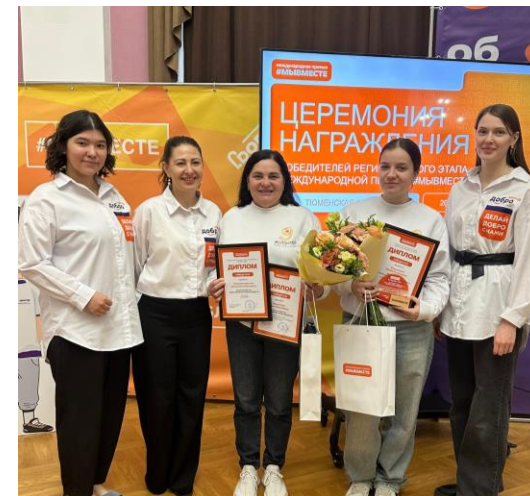
Региональный этап Международной Премии #МЫВМЕСТЕ 2025

В 2025 году в конкурсах приняли участие 804 обучающихся Молодежного центра.