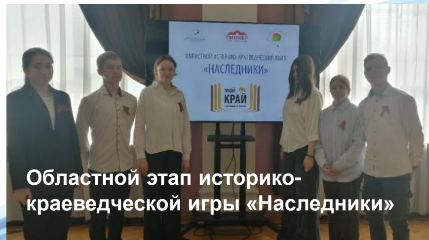
Областной этап историко-краеведческой игры «Наследники»