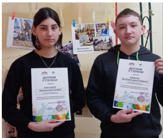
Региональный этап Всероссийского конкурса экологических проектов «Волонтёры могут всё»