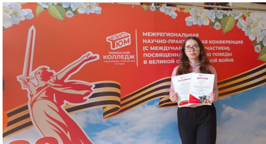
Региональная научно-практическая конференция (с международным участием) посвященная 80-летию Победы в Великой Отечественной войне