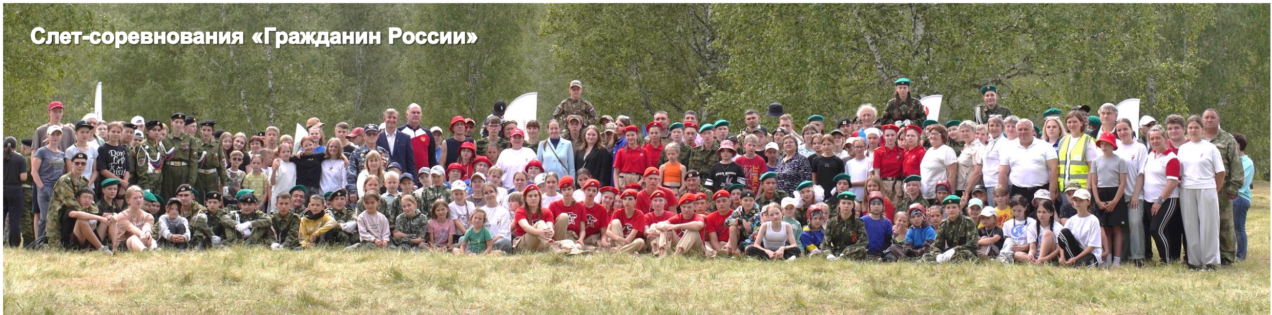
Слет-соревнования «Гражданин России»