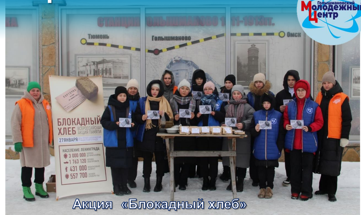
Акция «Блокадный хлеб»