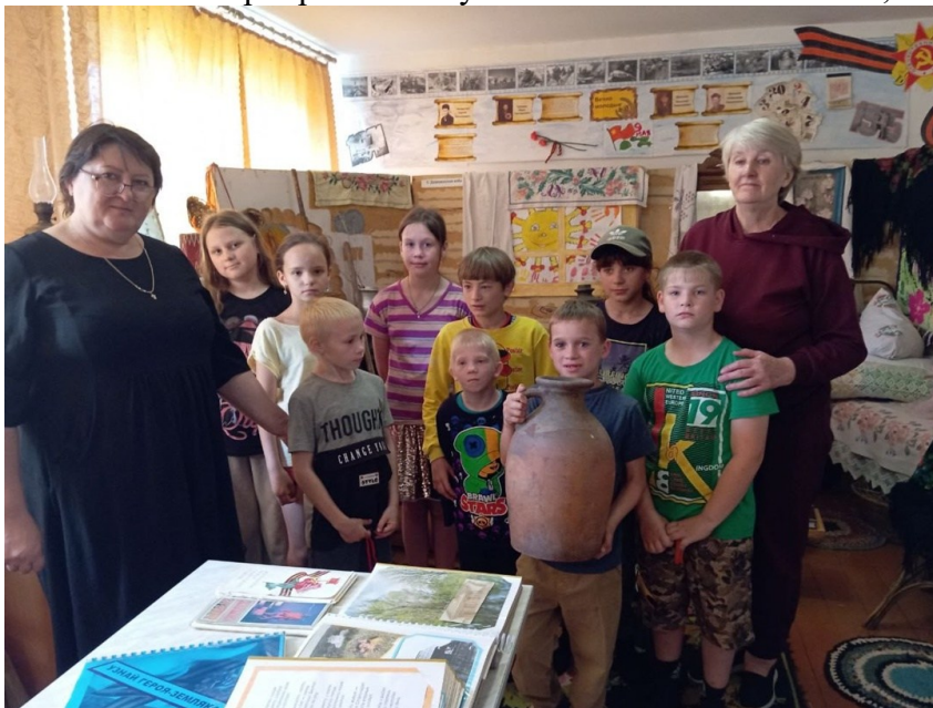
«Путешествие в прошлое»