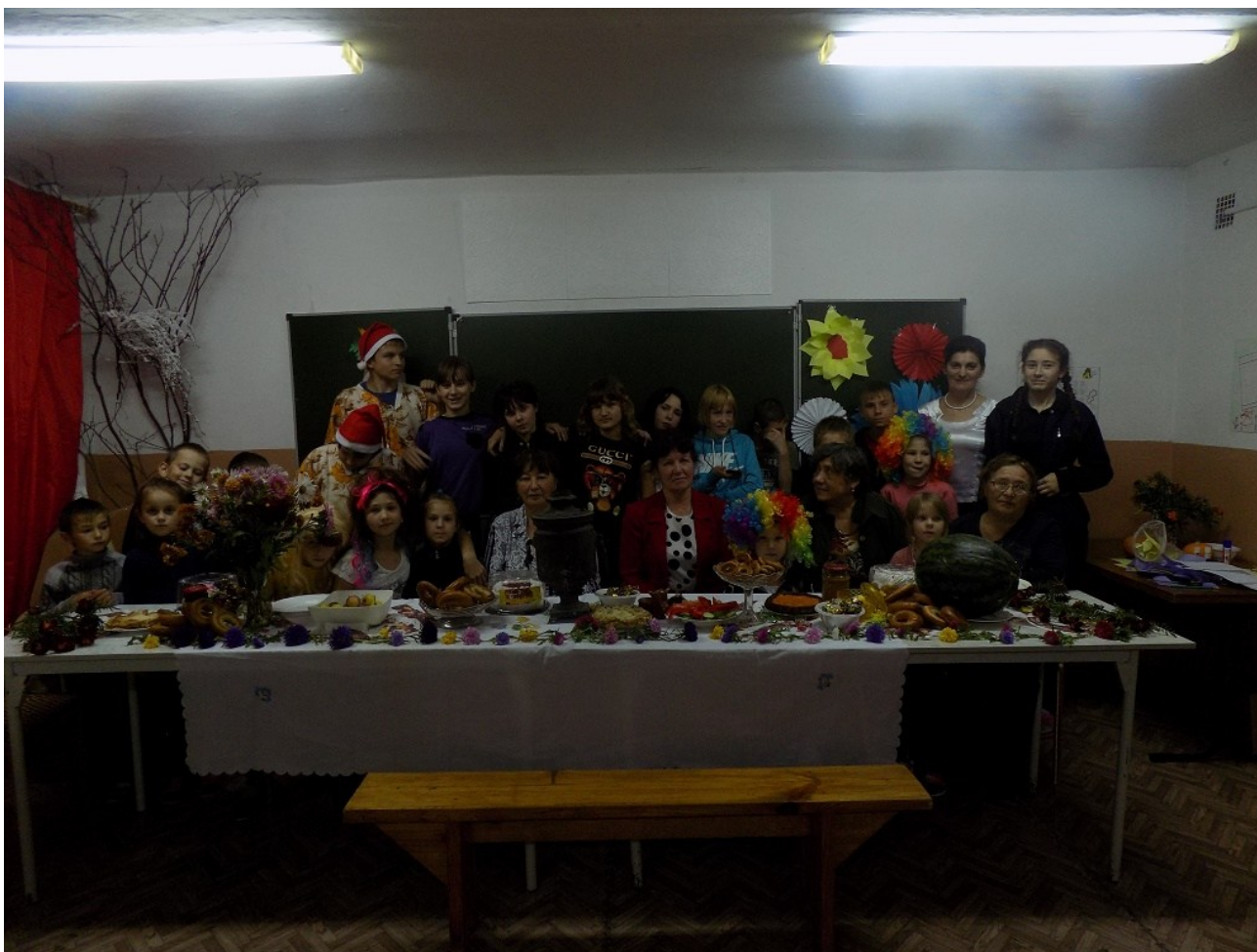
Встречаем праздник «Покров день»