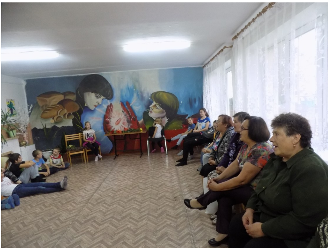
«Моя любимая бабушка-подружка» (Батл)