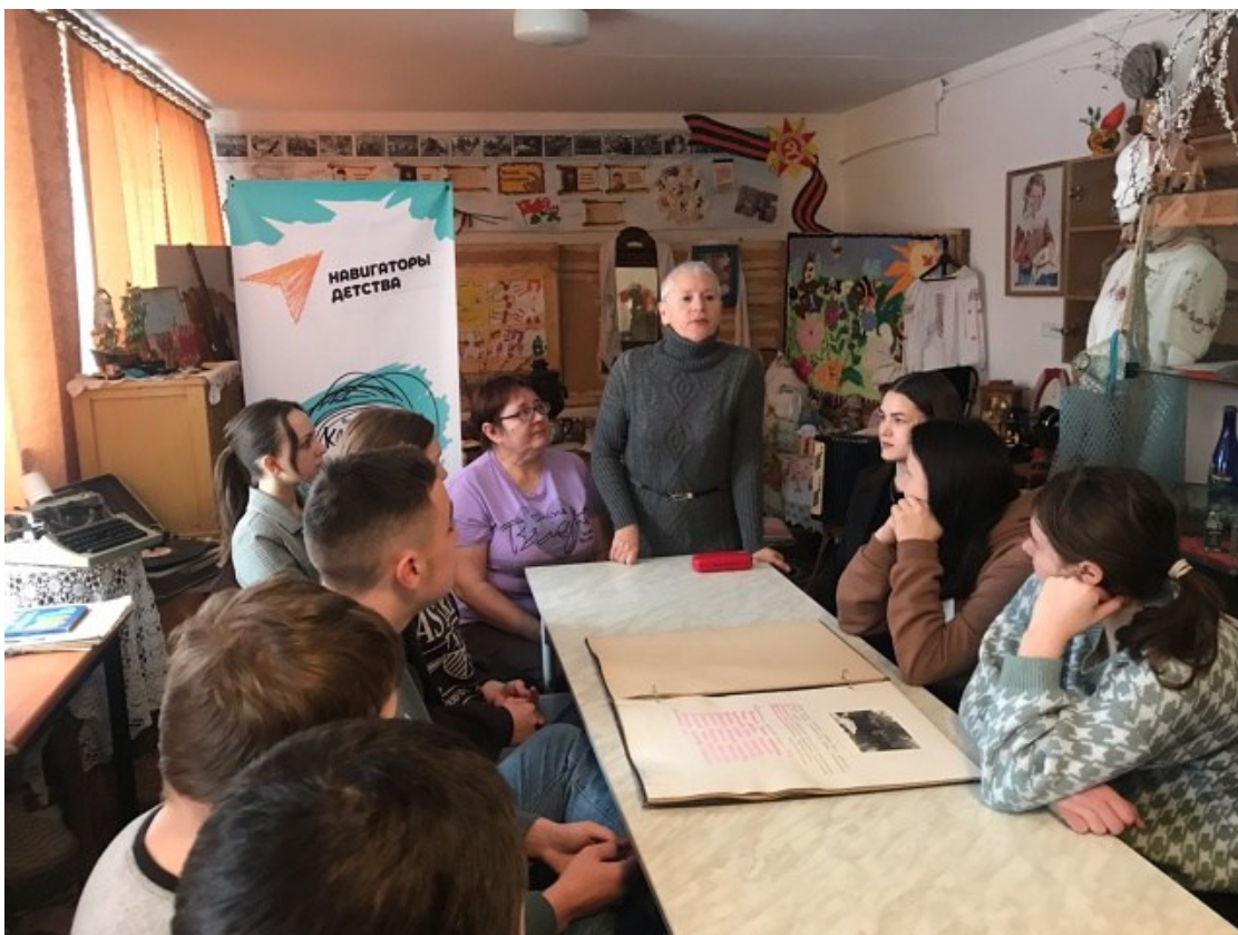
Внеклассное мероприятие «Не расстанусь с комсомолом, буду вечно молодым!»