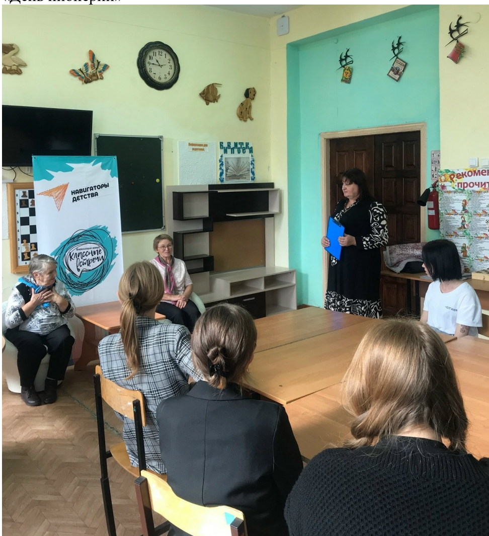
«Классная встреча» на тему «Профессия учитель»