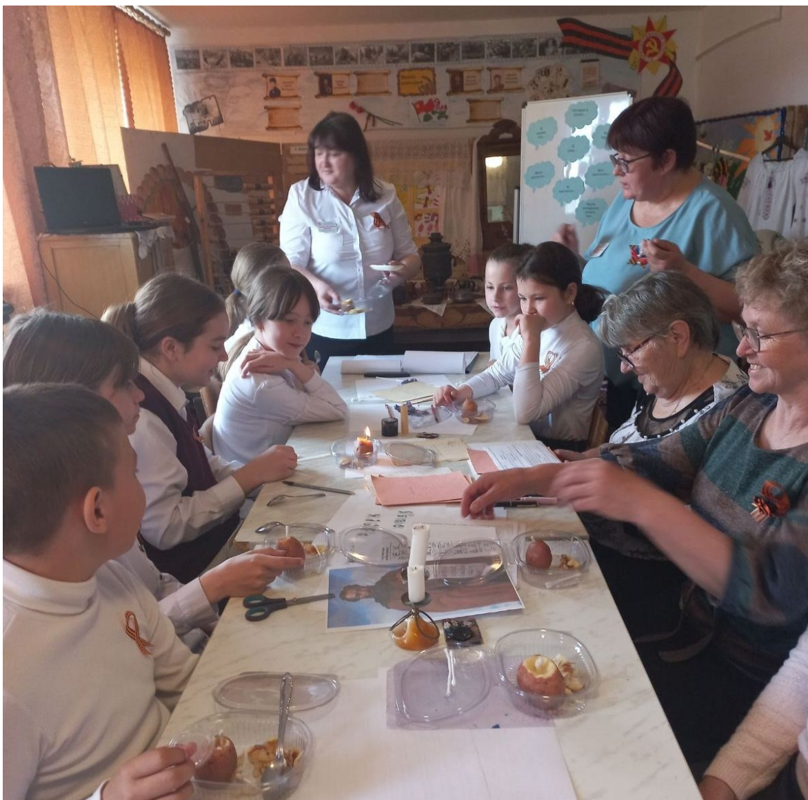
Внеклассное мероприятие в музейной комнате «Это было, было...»