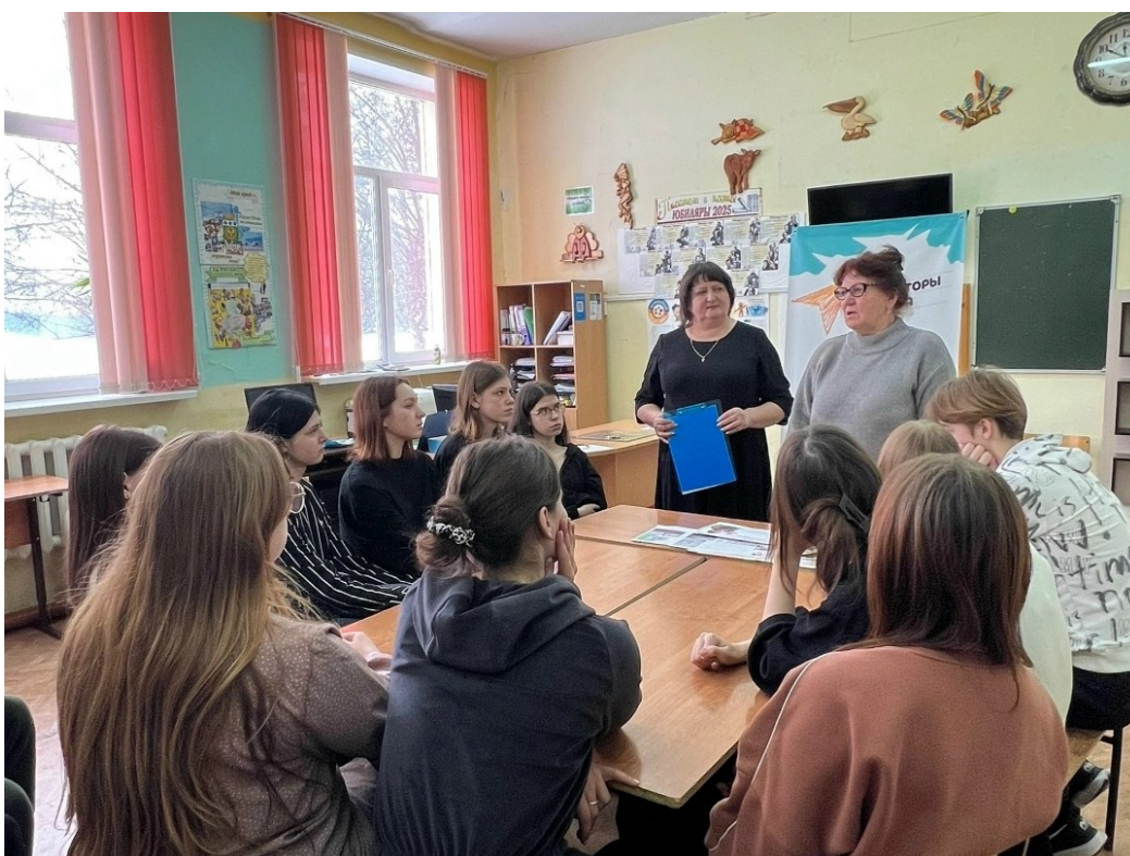
Профориентационная встреча «Профессия фельдшер»