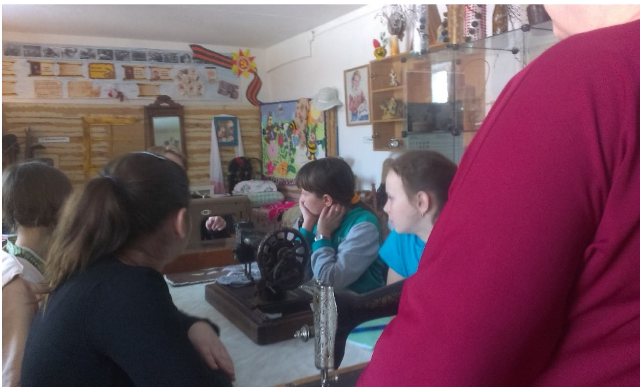
Встреча в музее «Исчезнувшие деревни сельского поселения»