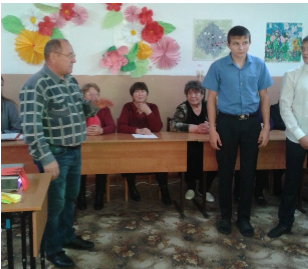
Круглый стол со старшеклассниками «Лестница вверх или мои жизненные ценности»