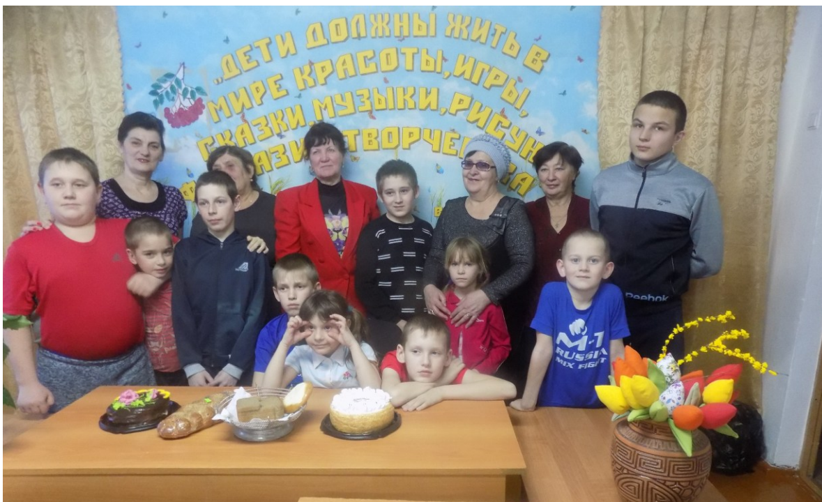
«День снятия блокады Ленинграда»