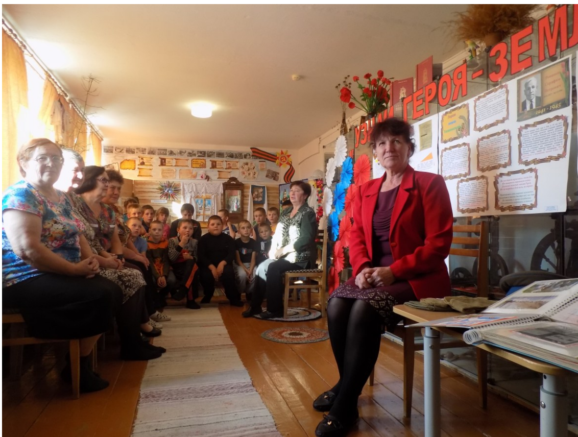
«Узнай героя –земляка»