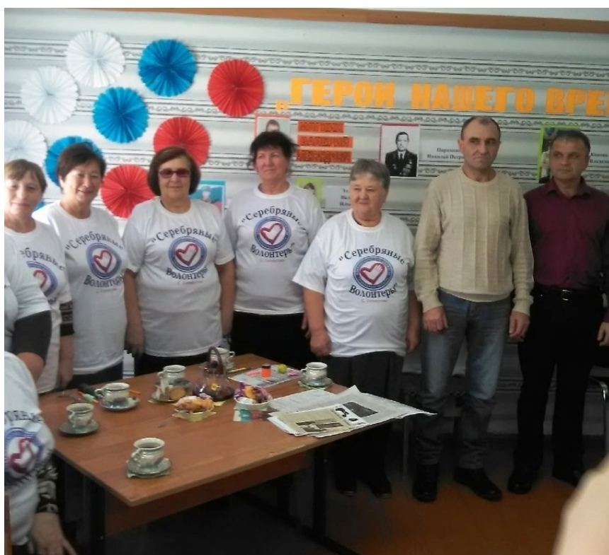
Встреча «Герои нашего времени»