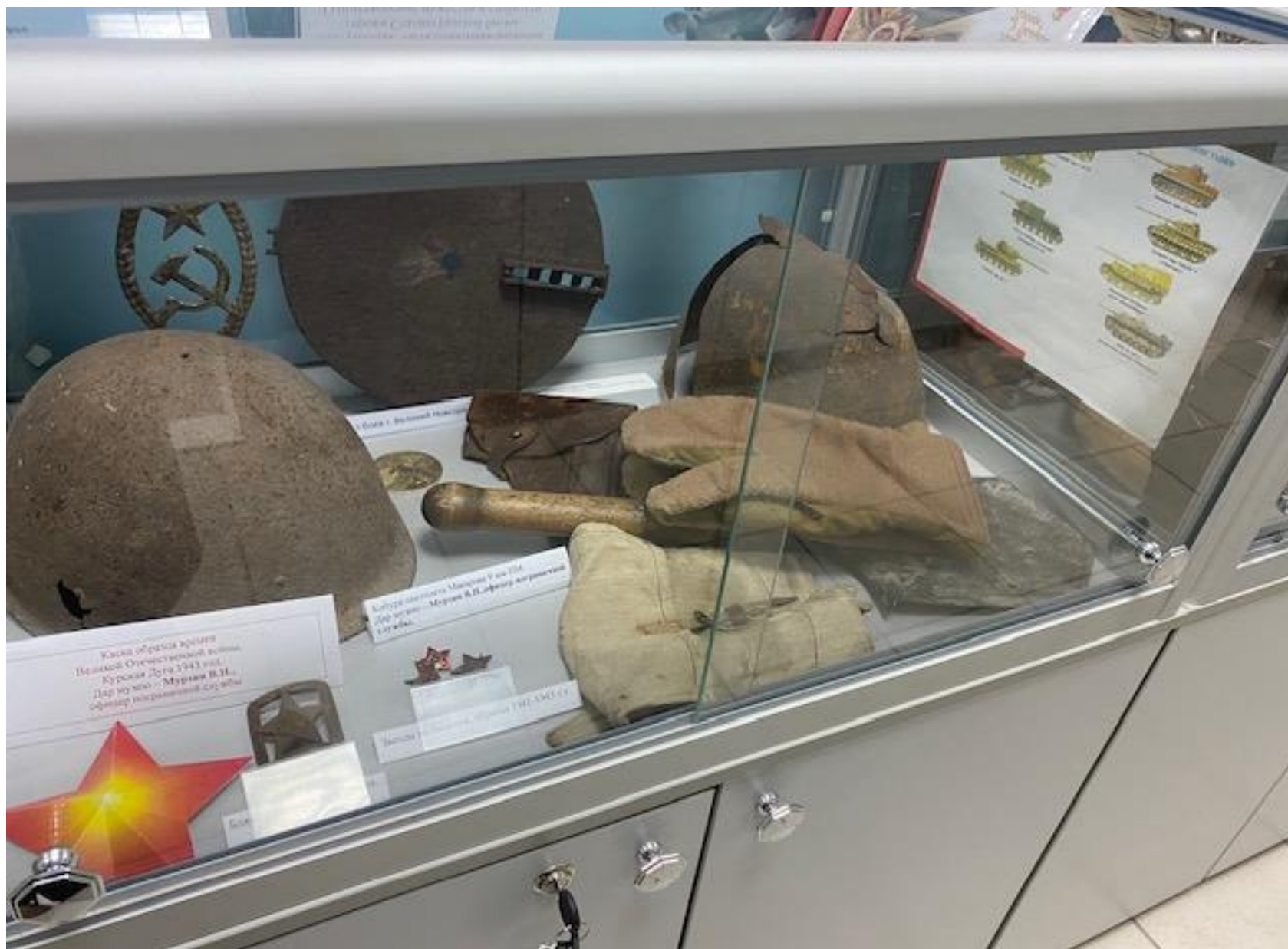
Экспонаты с раскопок на Пулковских высотах. Собраны кадетами отрядов Сокол-1,Сокол-2. 2005 год