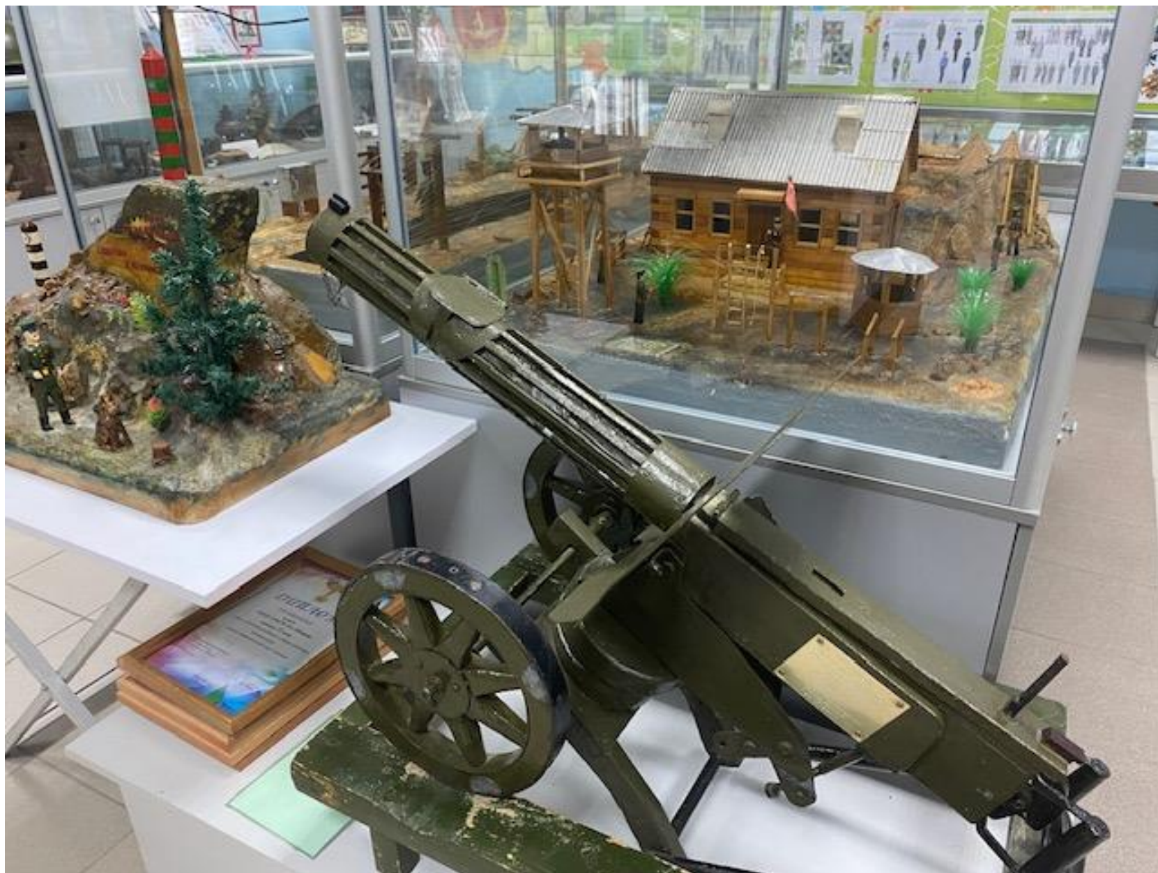
Макет пулемет Максим. Автор Селиванов Ю.А.