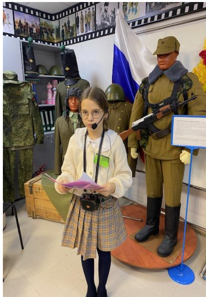
Юные экскурсоводы ученики 4 класса