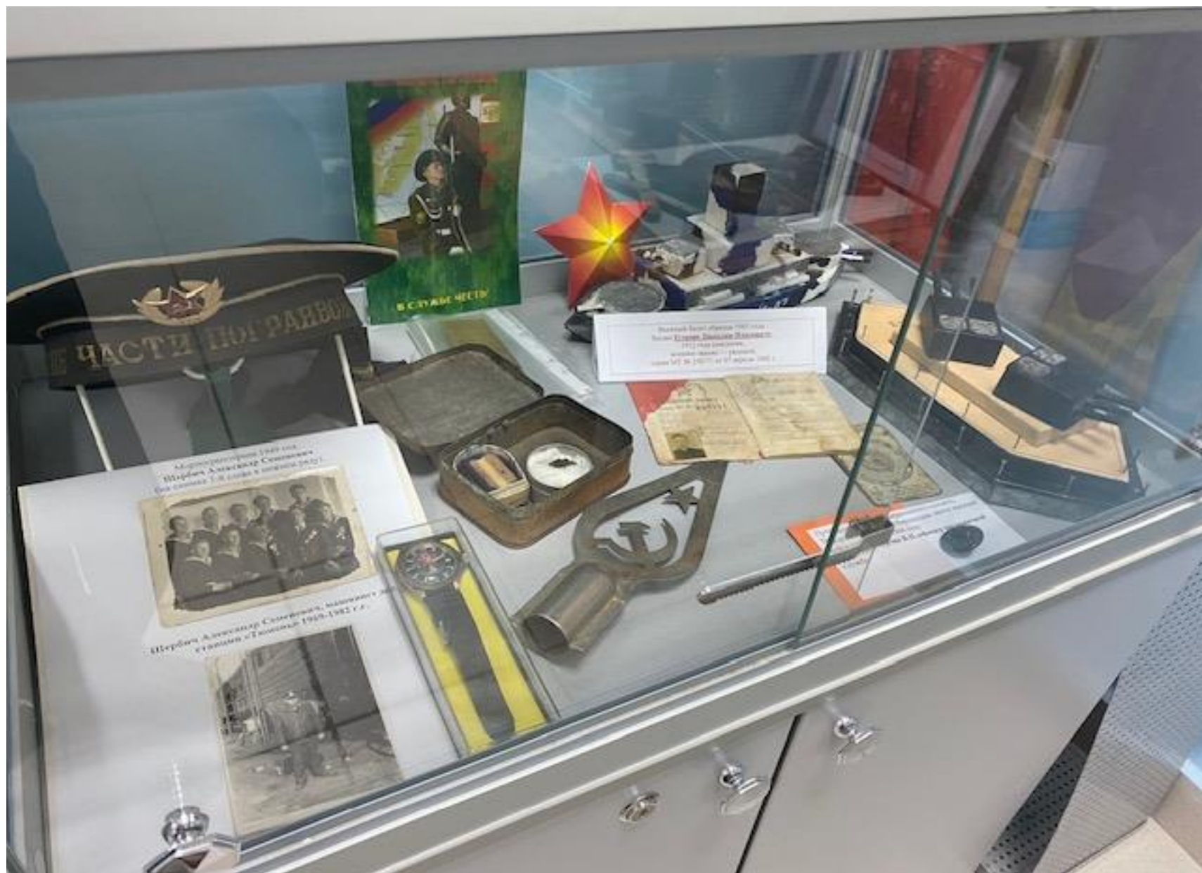
История страны в истории вещей