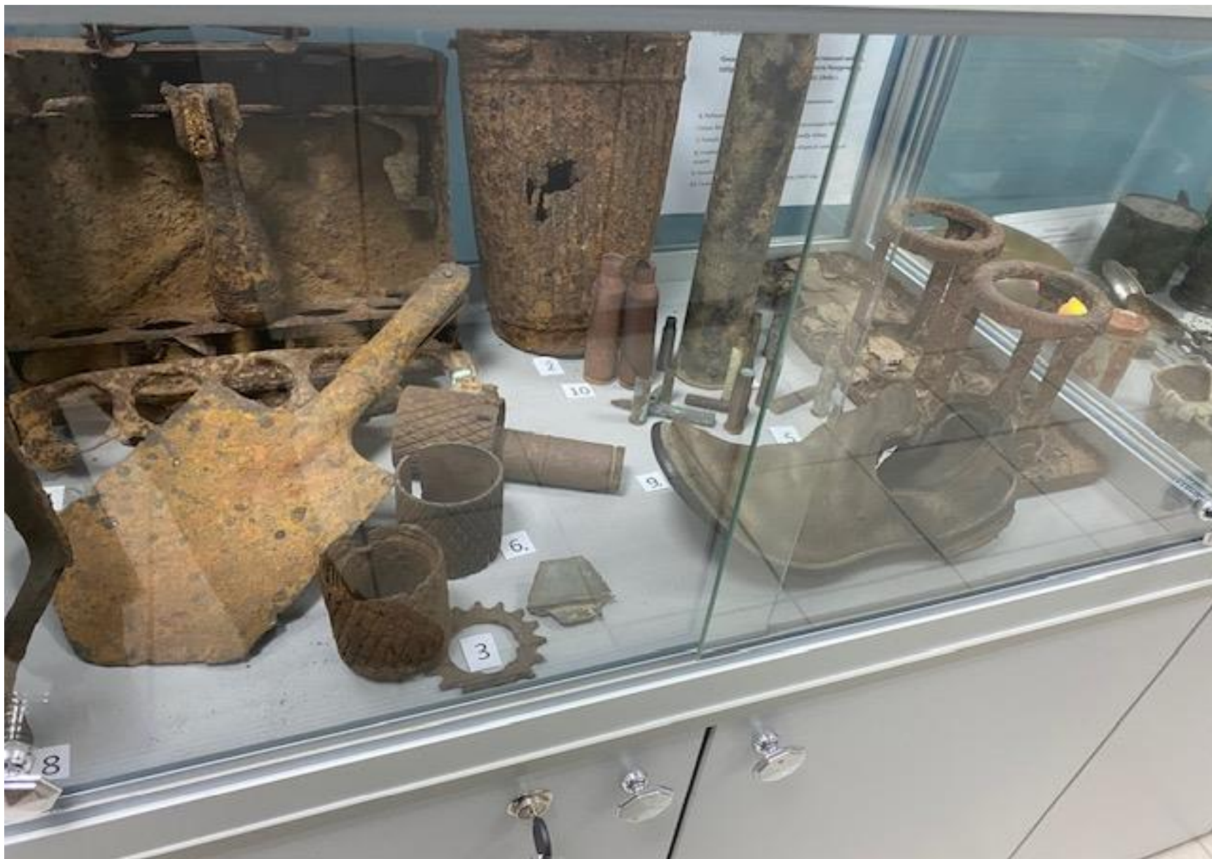
Экспонаты с раскопок на Пулковских высотах. Собраны кадетами отрядов Сокол-1, Сокол-2. 2005 год