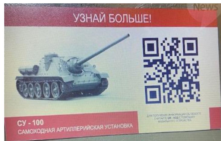
В музее действует система Q-кодов