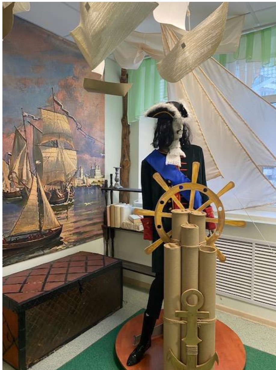
Фрагмент экспозиции «От Руси до России», 2023 год