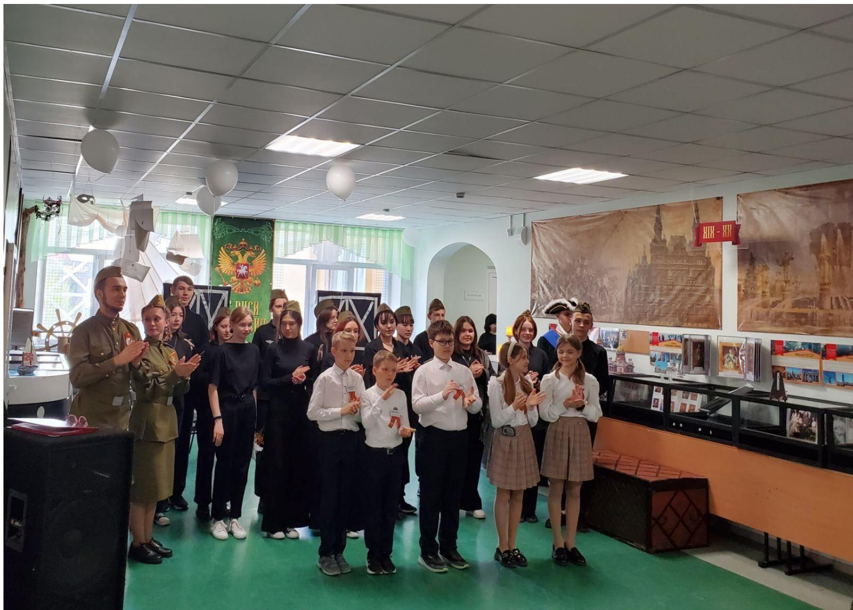
Открытие новой тематической выставки «От Руси до России», 2023 год