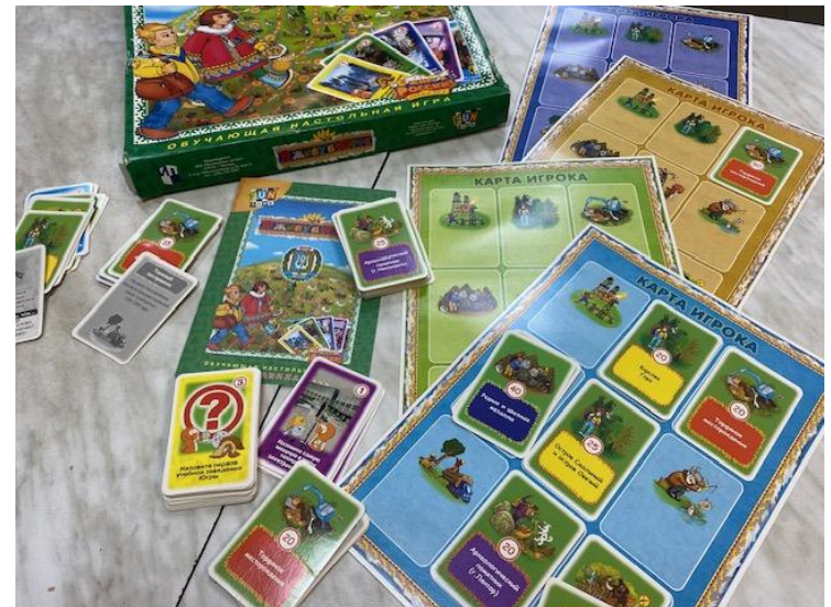
Настольная игра «Живу в Югре»