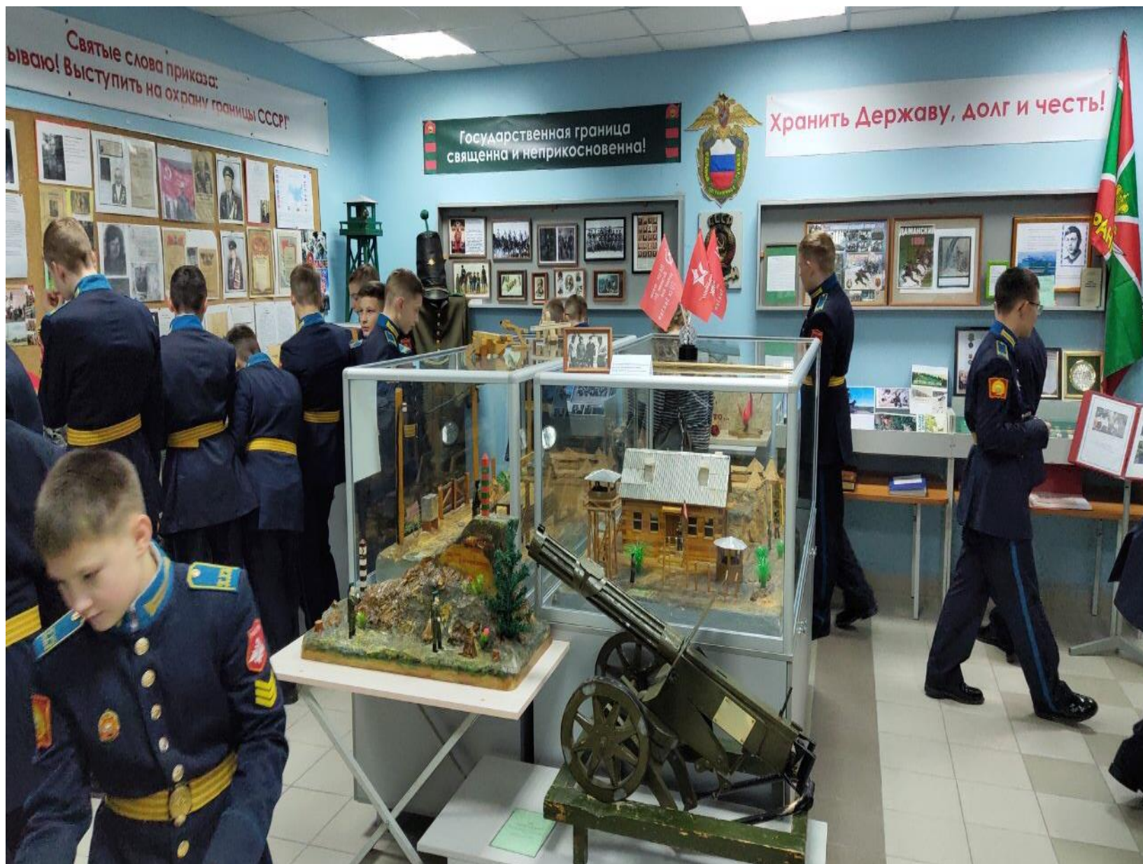
Гости музея из ТПКУ