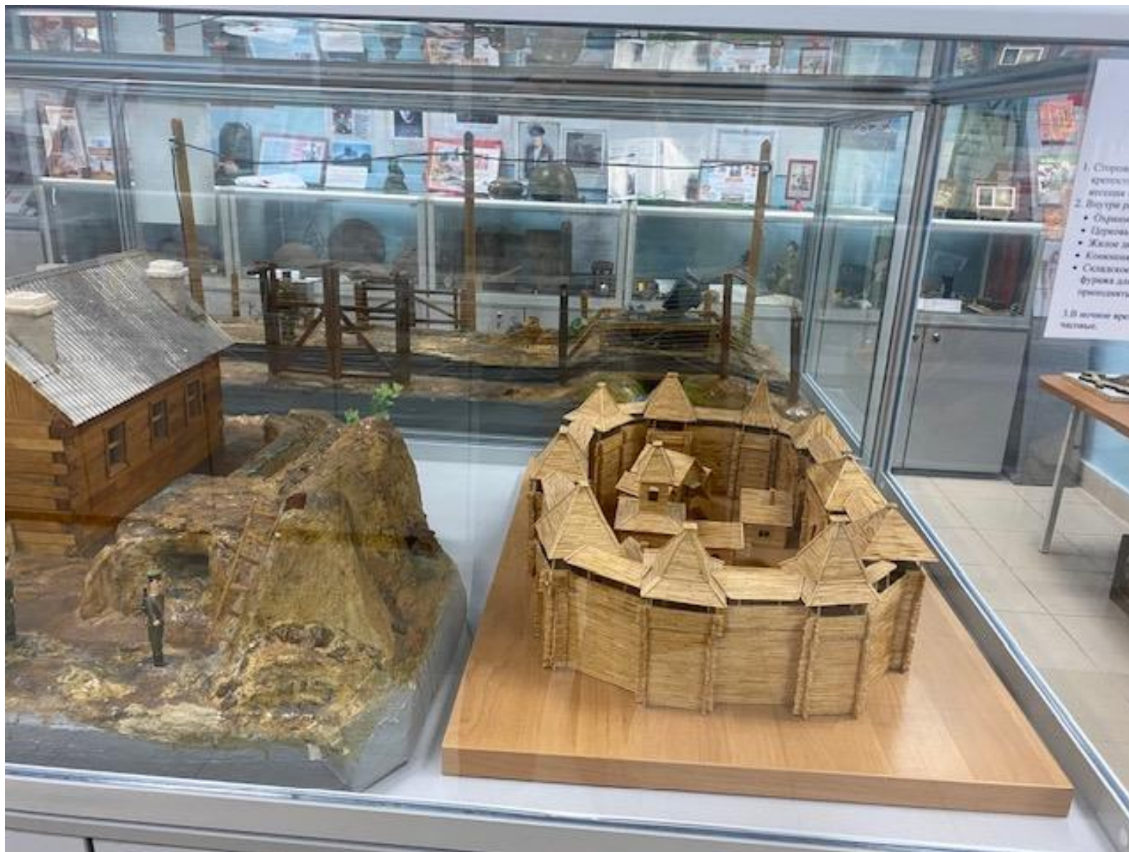
Макеты погранзаставы 15 века, 20 века. Автор Селиванов Ю.А.