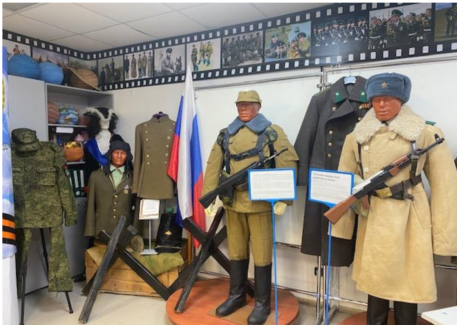
Видеозал с экспозицией военной формы и обмундирования «От кольчуги до мундира»