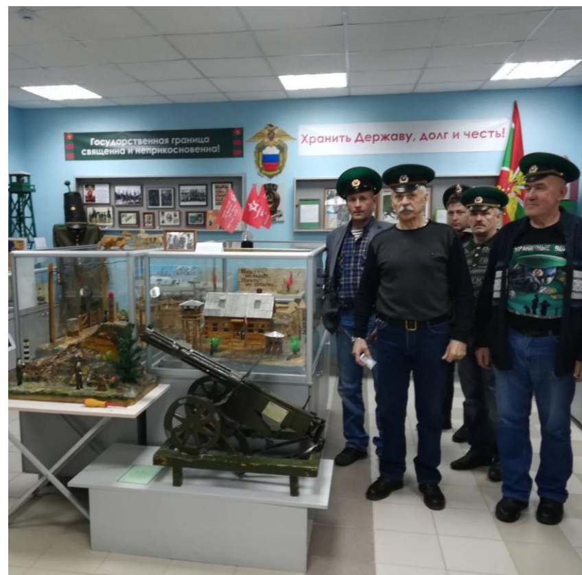
Гости музея ветераны-пограничники из Кемерово