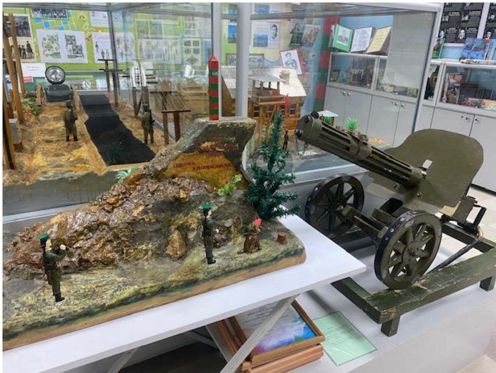
Макеты Пограничный ландшафт и пограничная полоса. Автор Селиванов Ю.А.