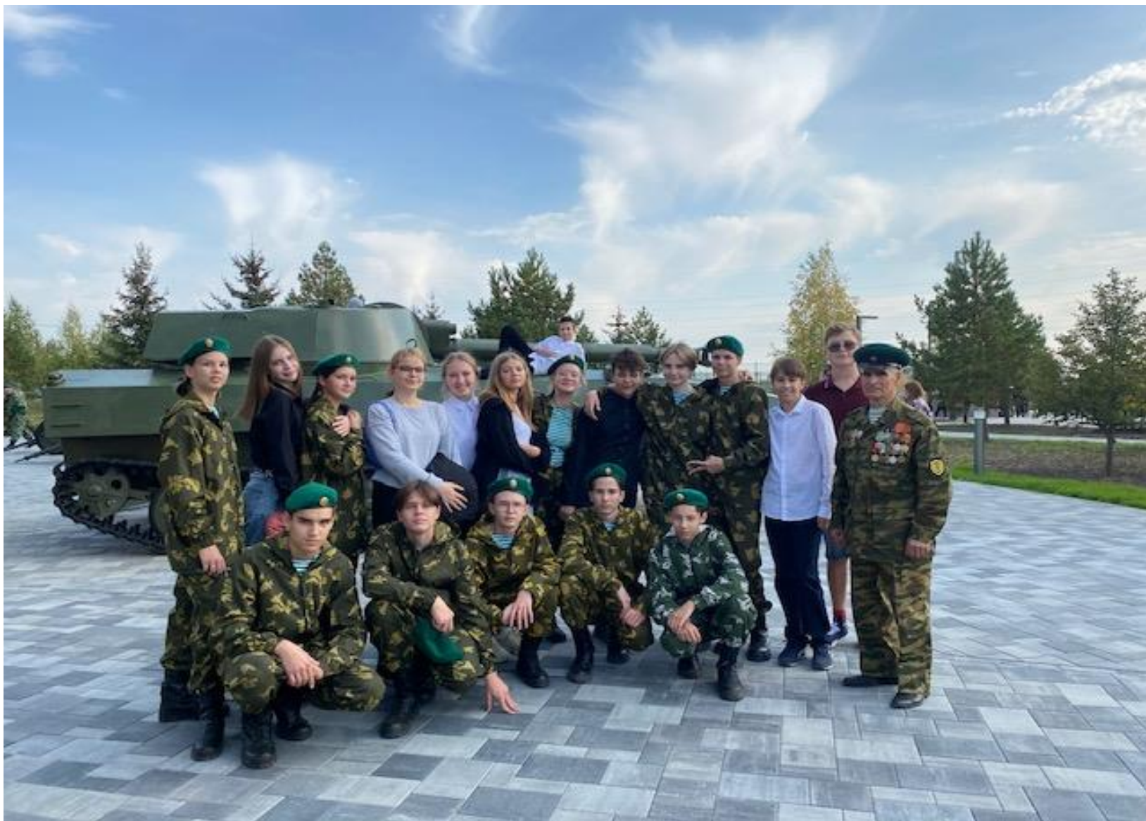
Команда военно-патриотического клуба «Патриот» Актив музея- ученики 10 класса