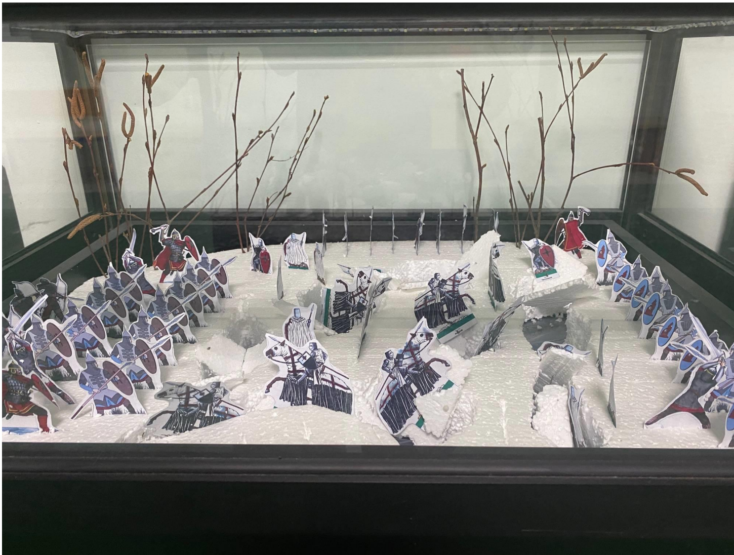
Проект «Ледовое побоище». Выполнили ученики 6 класса