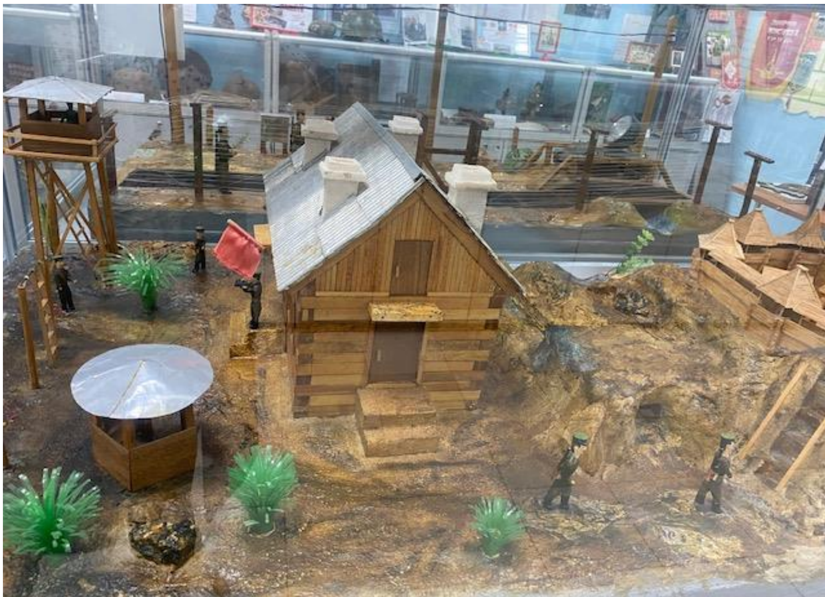
Макет погранзаставы. Автор Селиванов Ю.А.