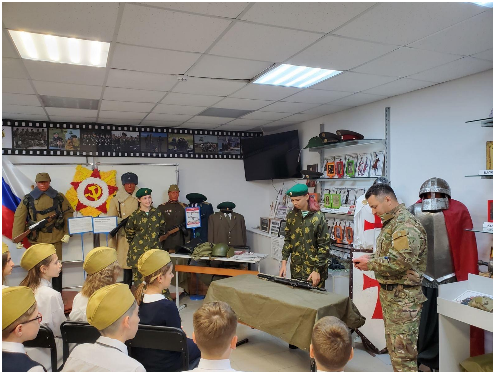
Активисты музея из клуба «Патриот» на встрече с учениками 5 класса