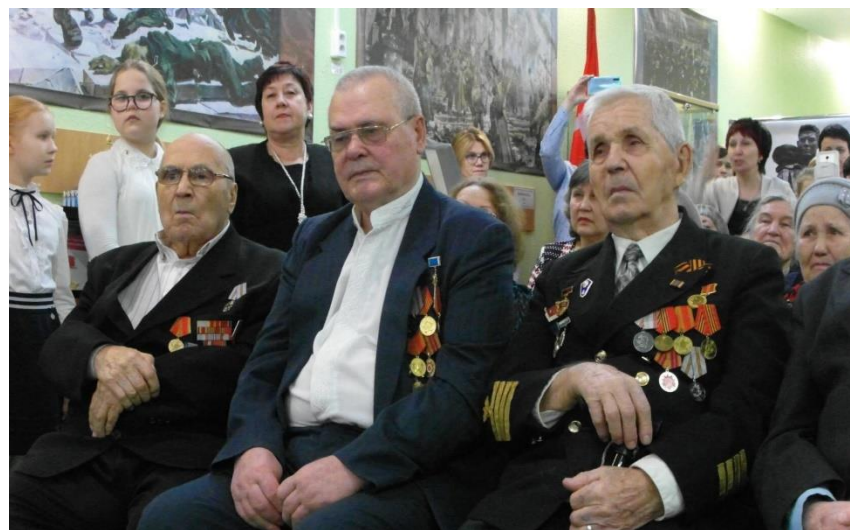
Концерт для ветеранов ВОВ в зале Победы