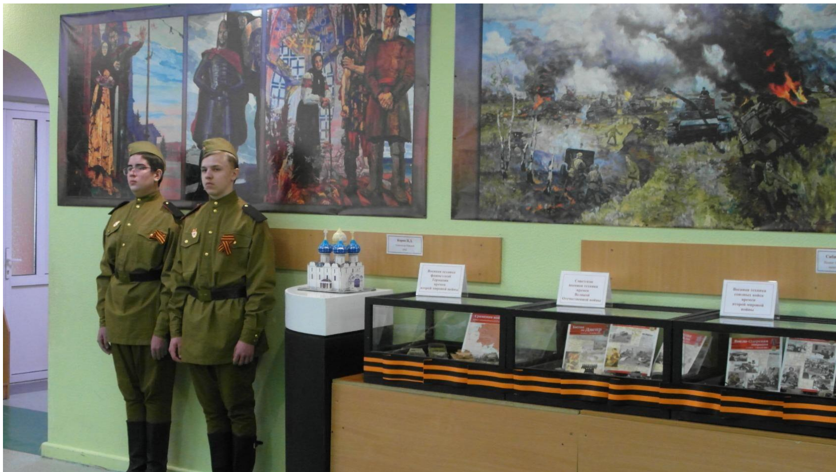
Экспозиция «Искусство, рожденное войной»