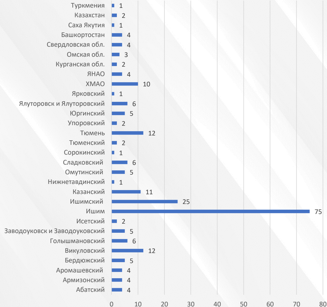
Зачисление 2023 в ИПИ им. П.П. Ершова

Экспертиза, рецензирование и оценка программ развития образовательных организаций