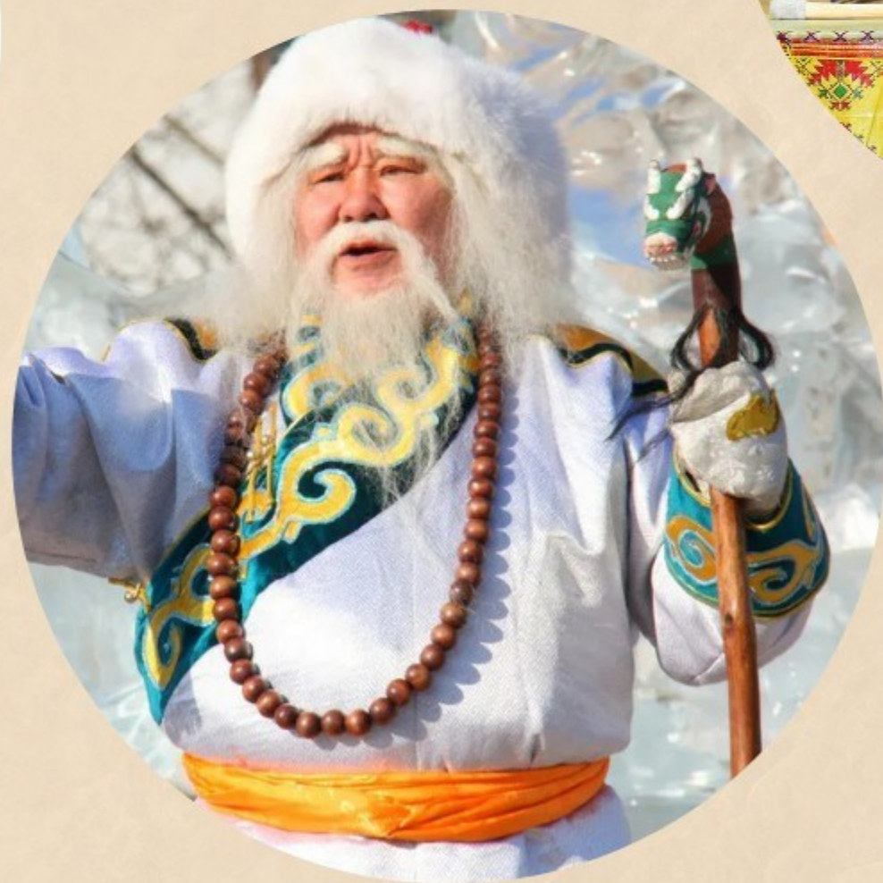
Саган Убген - Бурятия