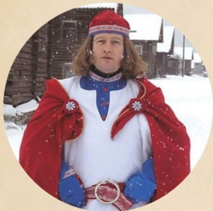
Паккайне - Карелия