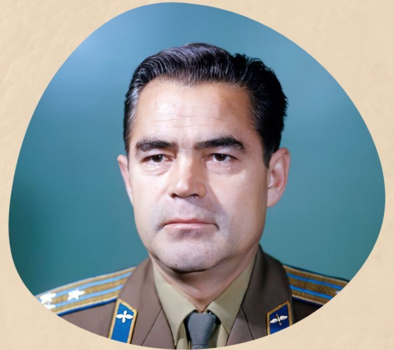
АНДРИЯН ГРИГОРЬЕВИЧ НИКОЛАЕВ, ЧУВАШ

«Мы даже из капсулы выйти не смогли, долго восстанавливались. Кстати, именно то, что с нами случилось, потом помогло впоследствии многим космонавтам избежать «эффекта Николаева», врачи разработали специальные методы подготовки к полетам на основе нашего опыта.»