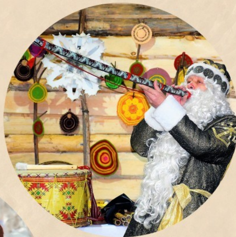
Хел Мучи - Чувашия