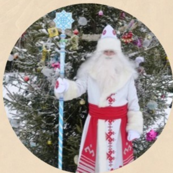
Йушто Кугыза - Марий Эл