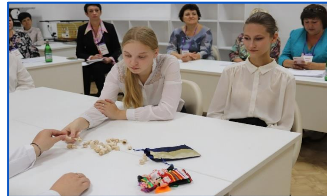
Волонтёры из ТКПиСТ на мастер-классе в рамках городского конкурса «Сердце отдаю детям»