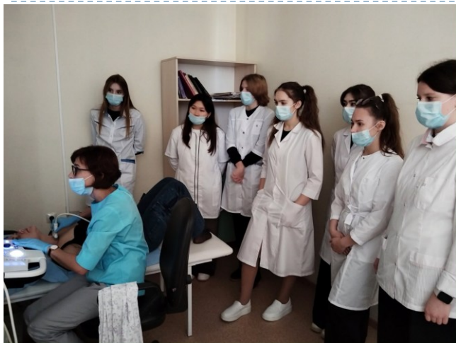
УЗИ щитовидной железы