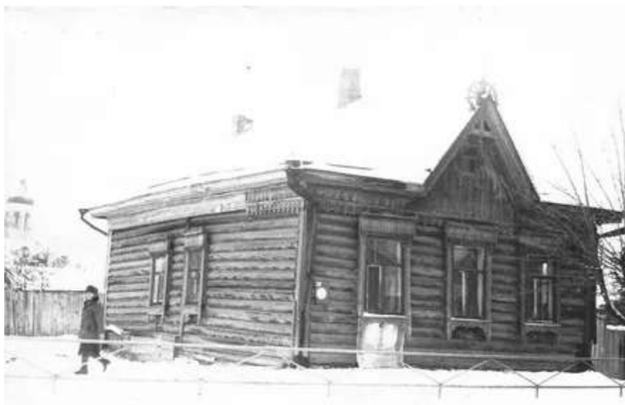
Дом купцов Сыромятников в г. Тобольске