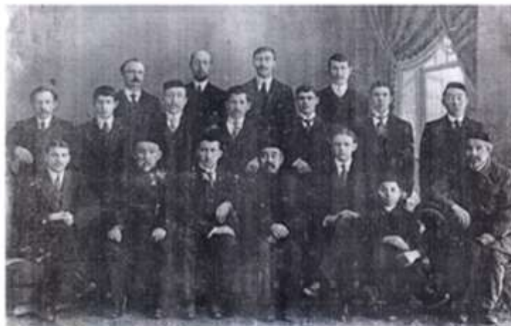
Торговые татары. г.Тобольск, нач. XX века