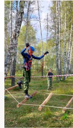
ФУНКЦИОНАЛЬ НАЯ ПОЛОСА