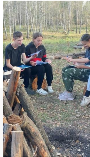
РАЗНООБРАЗНЫЕ МЕСТА ДЛЯ ПРОВЕДЕНИЯ ДОСУГОВОЙ ЧАСТИ