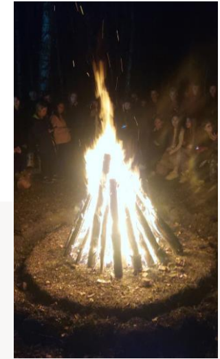
МЕСТО ОБЩЕГО СБОРА – КАМЕРНОСТЬ МЕРОПРИЯТИЯ