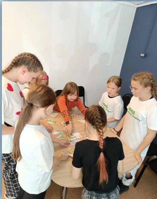
Фото-кейс и кейс-иллюстрация (содержит фотографии и иллюстрации дорожных ситуаций, посмотрев на которые обучающиеся могут предложить решение проблемной ситуации)