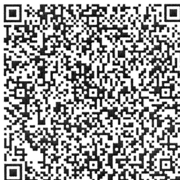
QR код для оплаты

МОЖНО ОПЛАТИТЬ по QR коду через приложение банка