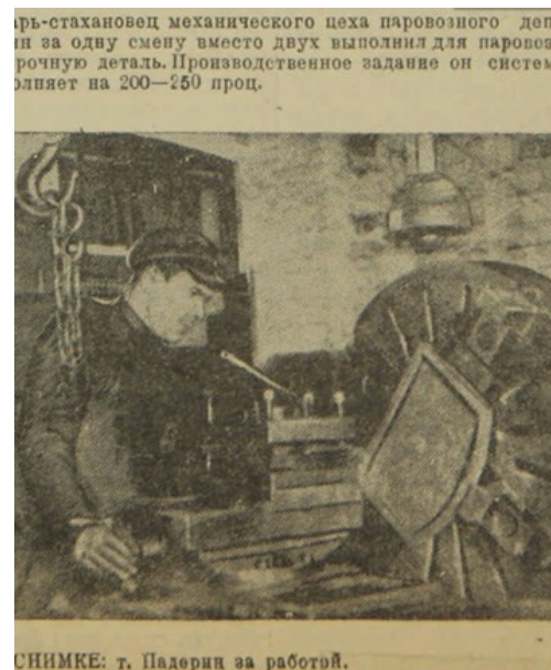
СНИМКИ: г. Падерн за работой.