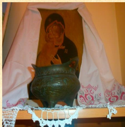
* Икона Божьей Матери. Худ.Сергей Салатин. Масляные краски. Дерево.