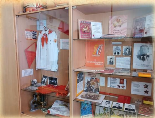
Экспозиция, посвященная 100-летию пионерскому движению.