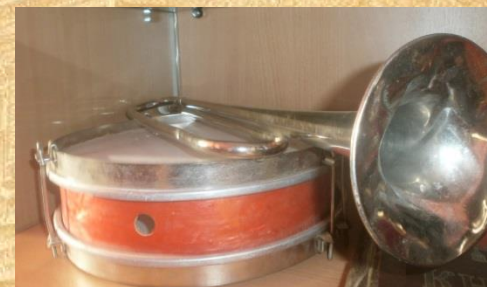
* Пионерский барабан школьной дружины им.З.А.Космодемьянской Ж/Д школы №5 ст. Ишима.