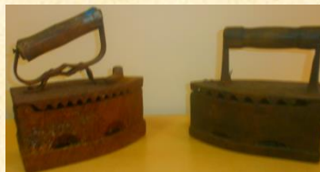
Утюги , нагревающиеся с помощью раскаленных углей. Металл. Подарок от Кравченко Л.И.