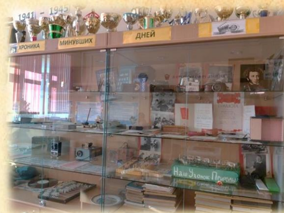
Экспозиция «Хроники минувших дней»