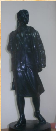
Малая скульптура З.А.Космодемьянской. Надпись «Комсомольцам Ишима в честь 1 слёта Молодых работников сферы обслуживания от комсомольцев горпищеторга. Тюмень. 19-20.12.66» Бронза. Литье. Касли.