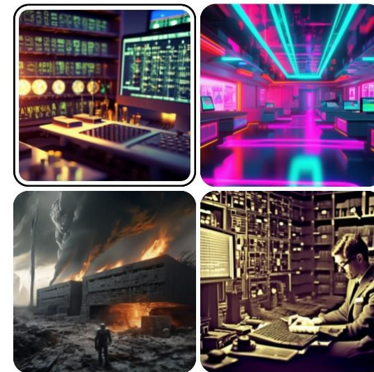
Пример рисунка по промпту «секретная информация»

В параграфе также рассматриваются методы обработки информации, такие как кодирование и декодирование, а также методы защиты информации.