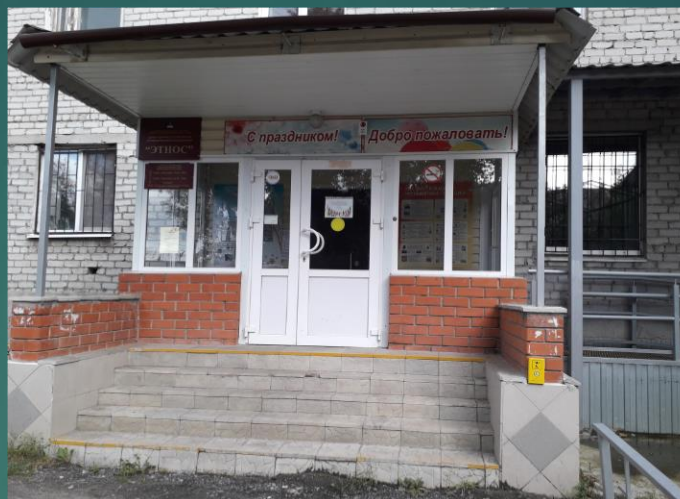
корпус 2: г. Тюмень, ул. Тимуровцев, д. 32/4