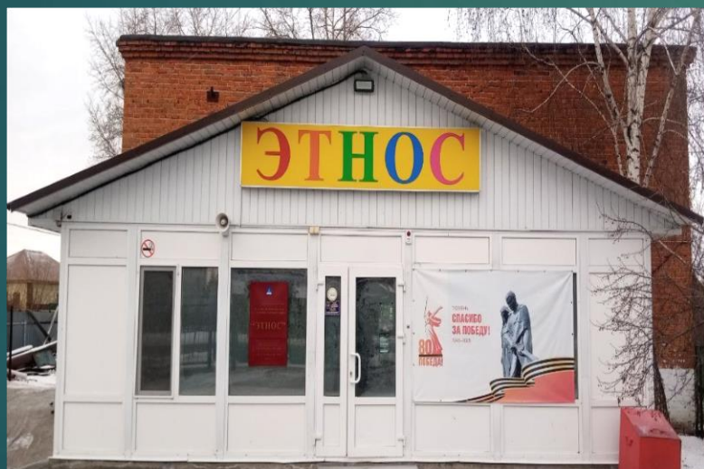
корпус 4: г. Тюмень, ул. Казаровская, д. 35