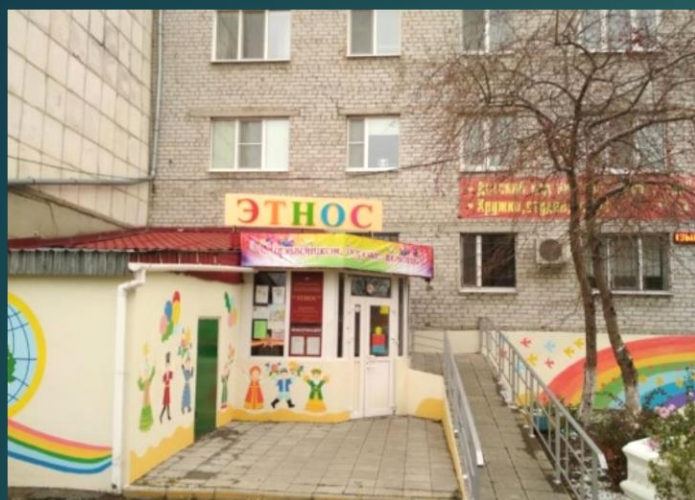
корпус 1: г. Тюмень, ул. Тимуровцев, д. 32/1