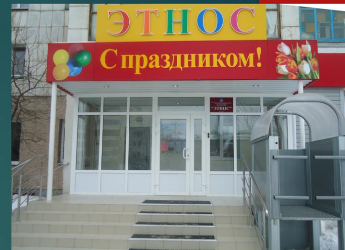
корпус 3: г. Тюмень, пр. Шаимский 14/1