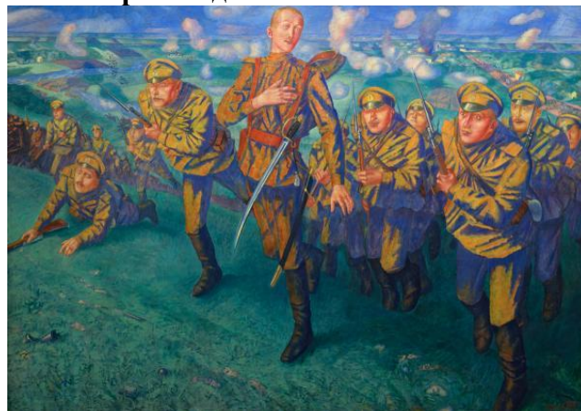
2. Петров-Водкин К. С. На линии огня