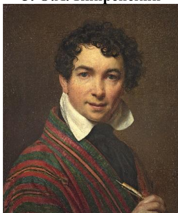
3. О.А. Кипренский