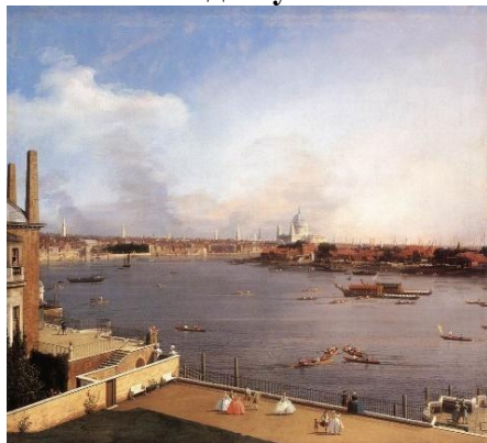
1. Каналетто. Вид на Темзу и Лондон из Ричмонд-хауса. 1747