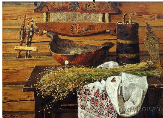
4. В.Ф. Стожаров «Лен»