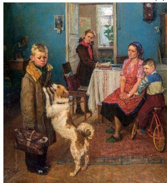
2. Ф. Решетников «Опять двойка»