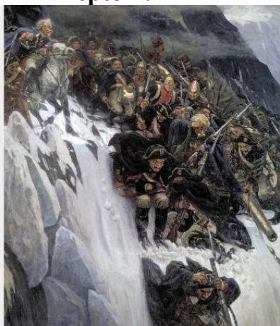
5. В.И. Суриков «Переход Суворова через Альпы»