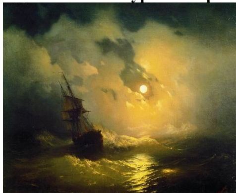
3. И.К. Айвазовский «Буря на море ночью»