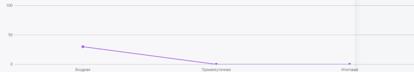
Выбор оптимальных методов, форм, приёмов и средств обучения