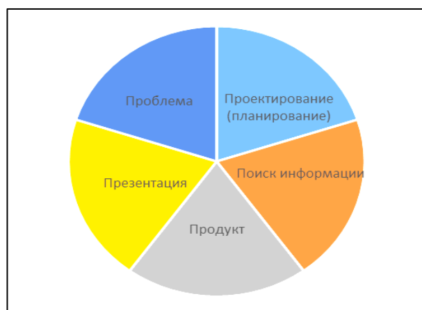
Этапы проекта (Пять П) Рис. 1. Этапы проектной деятельности

Понять и наглядно представить проект можно с помощью системы взаимосвязанных этапов - «пять П» (Рис. 1).