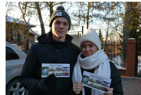
2023 г. - Архитектура