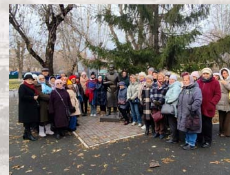
2025 г. - Медицина