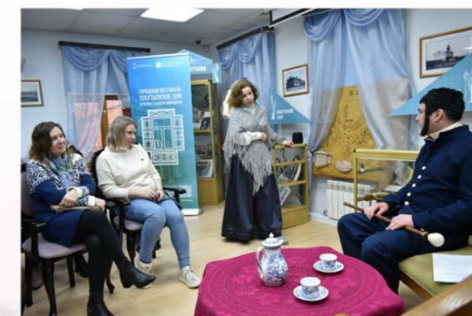
2024 г. - Театр