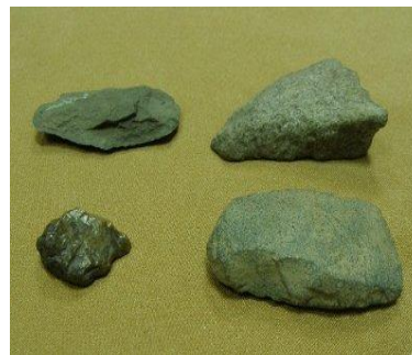
Каменные скребки озера(южный берег Андреевского озера)