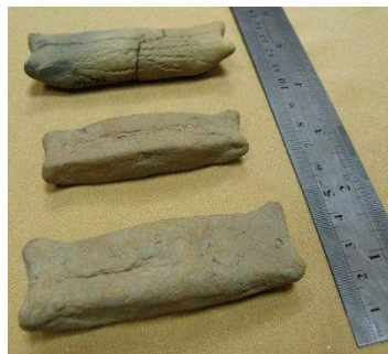
Грузила для сетей (южный берег Андреевского озера)