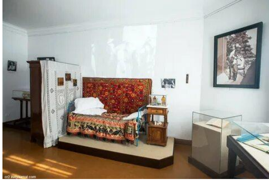
Комната цесаревича Алексея.