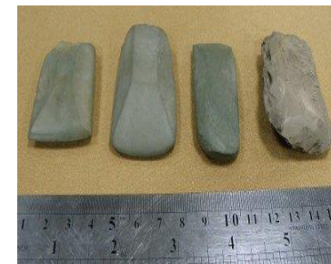
Каменные топоры озера(Большой остров Андреевского озера)