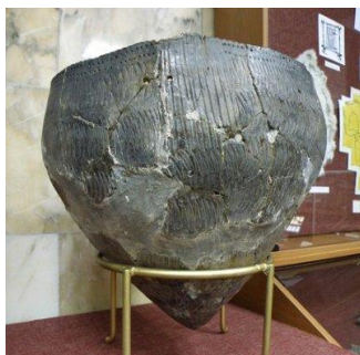
Глиняный сосуд (южный берег Андреевского озера)

О чём нам рассказывают эти находки? Предположите, чем занимались древние люди на территории нашего региона? Какой образ жизни они вели? Какими ремёслами занимались? Почему среди находок этой эпохи отсутствуют сельскохозяйственные орудия?