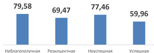
Индекс удовлетворенности родителей школой