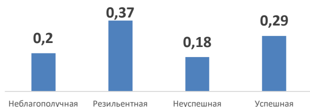
Индекс посещения внешкольных занятий