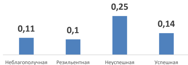
Индекс обеспеченности компьютерами с Интернет на 1 учащегося