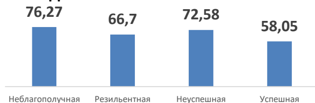
Индекс климата в школе