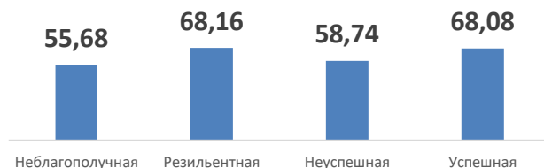
Индекс академических достижений 2019