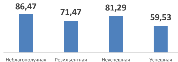
Индекс качества педагогического состава (ученики)