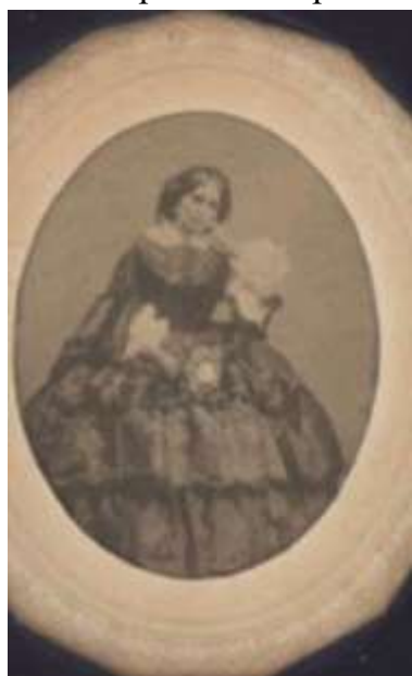
Фото Жозефины Муравьевой-Апостол. Платье эпохи кринолинов. Промышленный бум середины 19 века породил силуэт с кринолином. Он продержался в мировой моде около 15 лет и был первым массовым модным явлением для всех слоев городского общества. Это произошло благодаря его дешевизне и доступности даже в универмагах и на рынках.

Фото7 //Госкаталог РФ. – URL : https://goskatalog.ru/portal/?ysclid=mml2vwampu245749435#/collections?id=19895520 (дата обращения: 09.03.2026). Номер в Госкаталоге: 19760715, Номер по КП (ГИК): ТМ-15971, Инвентарный номер: ИФ-10262