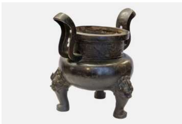
Приложение 3 – Курильница художественная. Культура ароматов (сян вэньхуа) является неотъемлемой частью истории Китая. Ее ключевым материальным воплощением выступают курильницы — сосуды для сжигания благовоний. На трех ногах сосуда видны головы львов — символа могущества и успеха в Китае. (Источник: коллекция музея «Усадьба Колокольниковых» музейного комплекса им. И.Я. Словцова. URL: https://ar.culture.ru/ru/subject/sosud-dlya-szhiganiya-blagovoniy (дата обращения: 10.03.2026)).