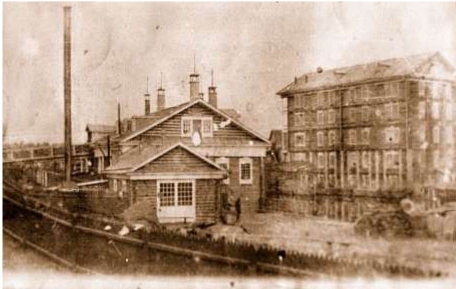
Паровая мельница 1870-1880 гг.