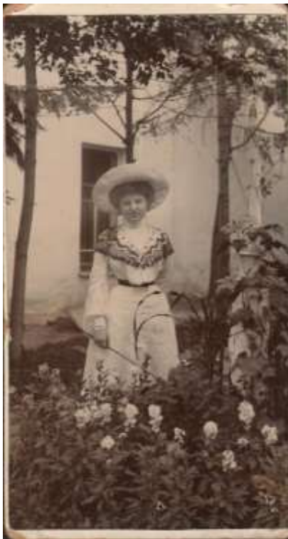
Фото 1. Номер в Госкаталоге: 3550093, Номер по КП (ГИК): ТМ-19620/18, Инвентарный номер: ИФ-1210. Госкаталог РФ. – URL: https://goskatalog.ru/portal/?ysclid=mml2vwampu245749435#/collections?id=3720828 ] (дата обращения: 09.03.2026)