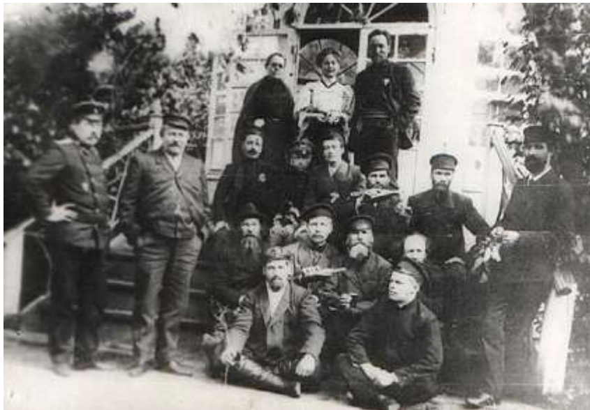
Оранжерея в усадьбе купцов Колмаковых, 1885 год