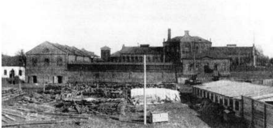
Приложение 4 – Жабынский механический завод. В 1872 году купцы Курбатов и Игнатов построили механический и судостроительный завод в 6 верстах от Тюмени (так