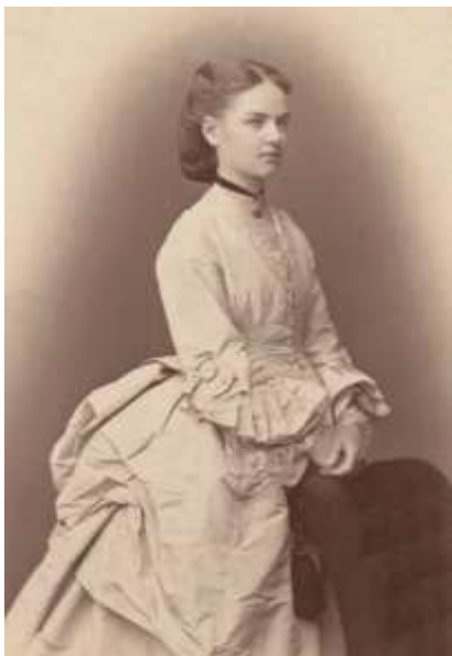
Фото 6. Место создания: Тобольская губ., г. Тобольск. Копия фотографии из фондов Тобольского историко-архитектурного музея-заповедника хранится в фонде мастерской «Катя и все её платья». Атрибутация Госкаталога на дату подготовки статьи утеряна.

Девочка в платье силуэта турнюров. Модный силуэт периода 1870х годов с характерным объемом на попе. После 60х объем юбки плавно уходит назад, пока перед не становится совершенно умеренным. Платье украшено оборками, кружевом и дополнительной драпировкой на юбке. Спереди платье застегивается на пуговицы. В V-образном вырезе виден нижний слой ткани. Образ дополнен модной прической и украшением - чокером на шее. Образ соответствует всем мировым модным тенденциям 1870 годов.