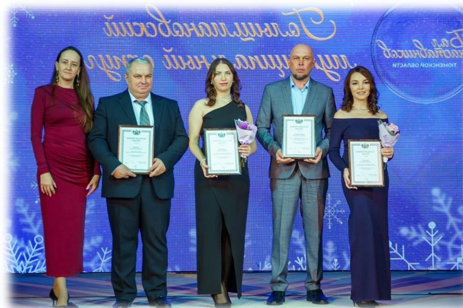
Бал наставников Тюменской области 2025год.