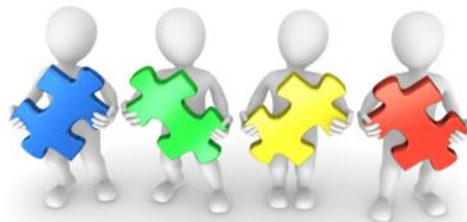
Специалисты ответственные за ведение программного комплекса «Банк данных семей и несовершеннолетних»