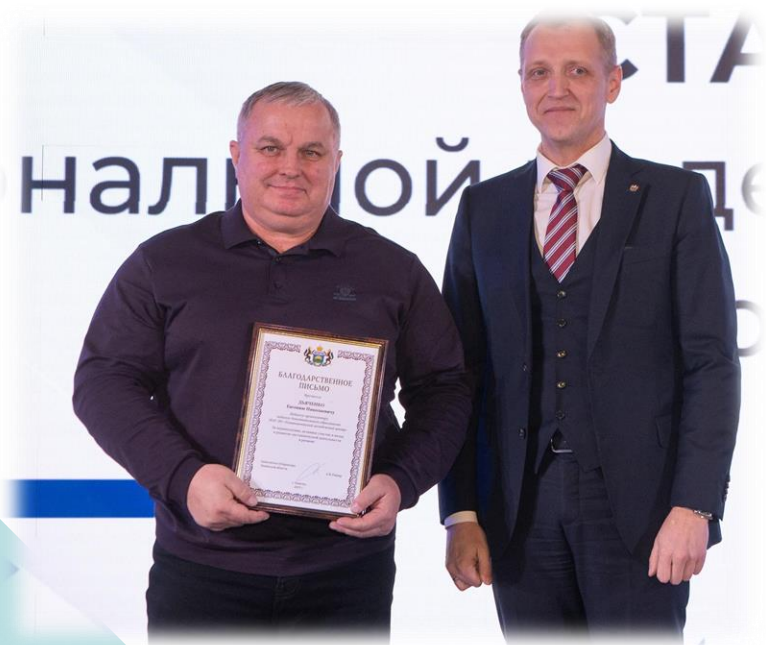
Благодарственные письма за неравнодушие, активное участие и вклад в развитие наставнической деятельности в регионе.