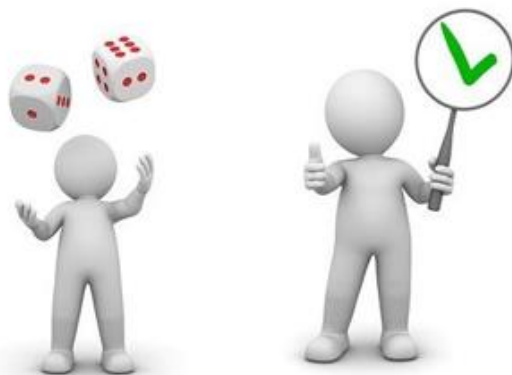
Досуговая занятость несовершеннолетних