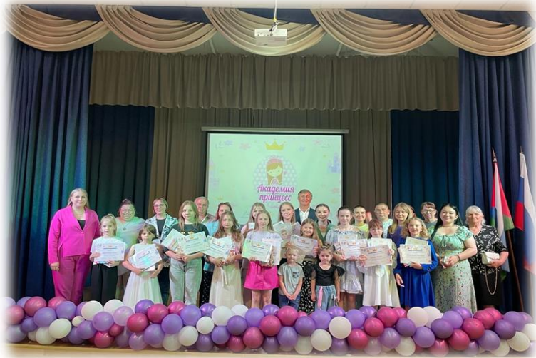
Слет-соревнования «Гражданин России»