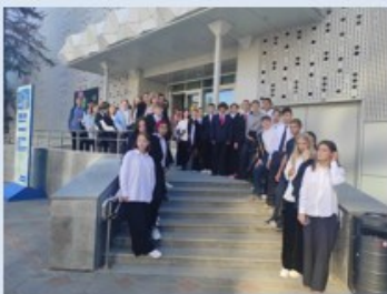
г. Тюмень, Россия- моя история