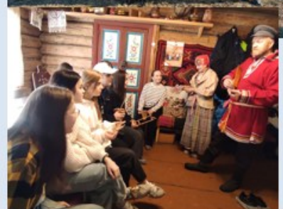
д. Насекина, Музей истории крестьянского быта