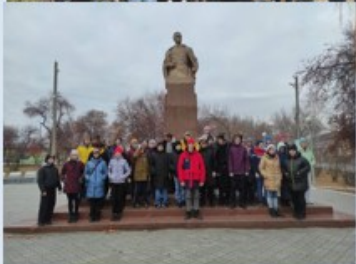
г. Талица, музей Кузнецова Н.И.