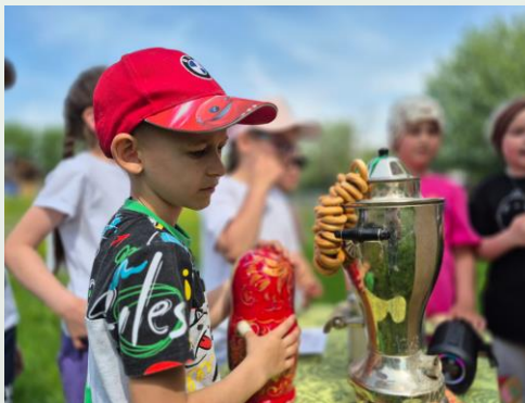
Русские, Татары, Казахи, Башкиры

Коренные народы Севера — хранители древних легенд