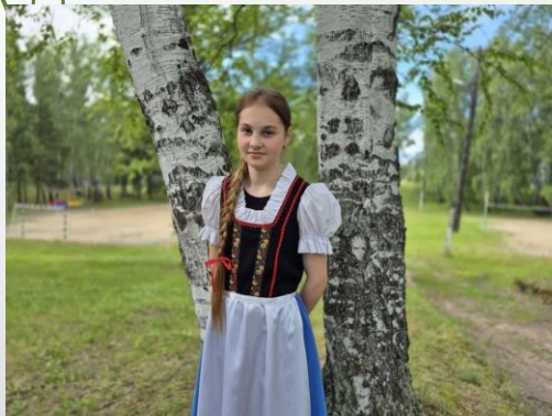
Ханты и Манси

Коренные народы Севера — хранители древних легенд