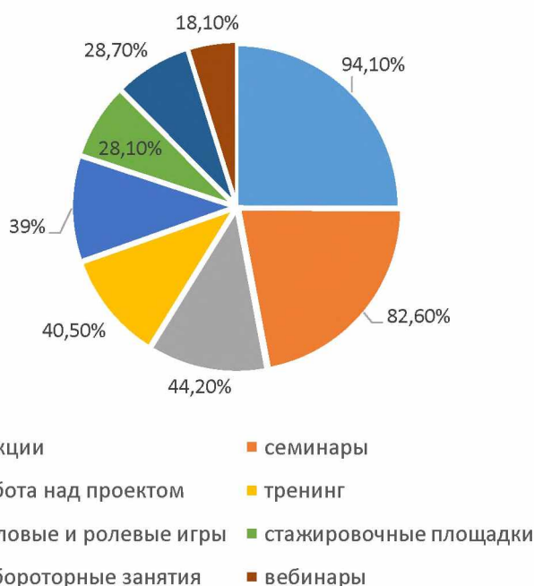
Высокий уровень эффективности форм обучения

- оценка технического сопровождения дистанционного модуля: