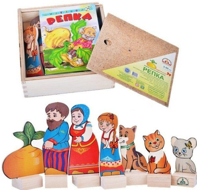
Картонажный театр «Репка»