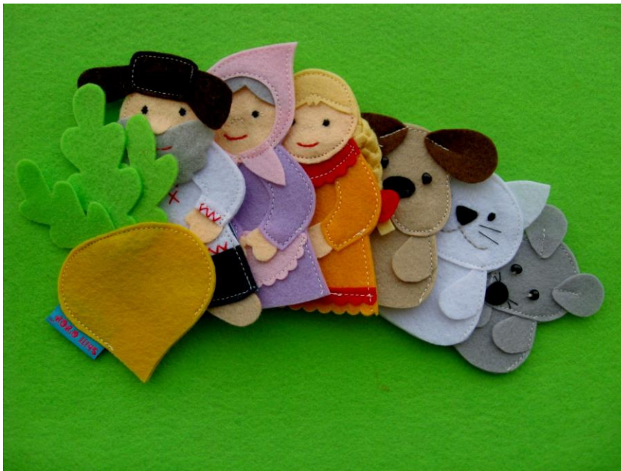
Пальчиковый театр «Репка»