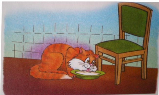
Сюжетная картинка «Кошка»