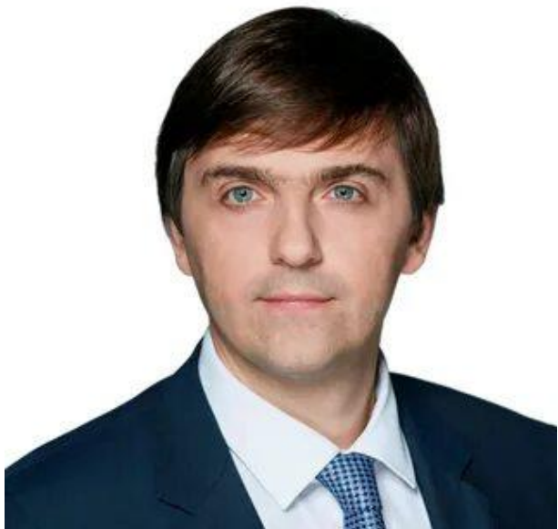
Кравцов Сергей Сергеевич, Министр просвещения Российской Федерации

«Подчеркну, что профориентация имеет колоссальный воспитательный потенциал. Благодаря профессионализму и активной позиции педагогов-навигаторов формируется интерес к выбору будущей профессии.»