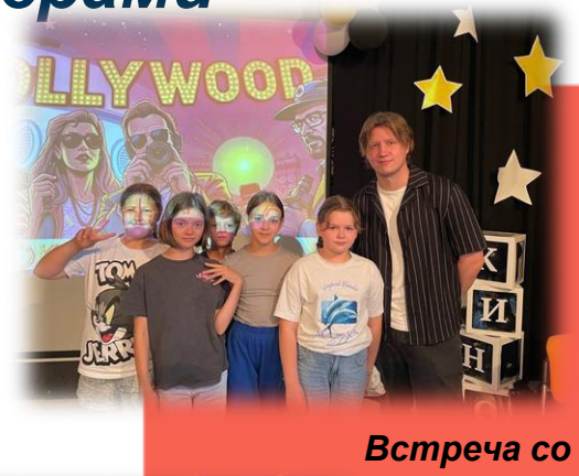
Встреча со специалистом кинокомпании «Пушка»