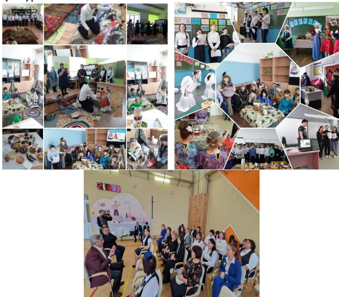
Рисунок 1 –Примеры интеграции культур и обсуждения в МАОУ Чикчинская СОШ

совместного роста. Развитие межкультурных навыков у детей не только обеспечивает лучшее взаимодействие, но и закладывает основу для их будущих успехов в многокультурном обществе.