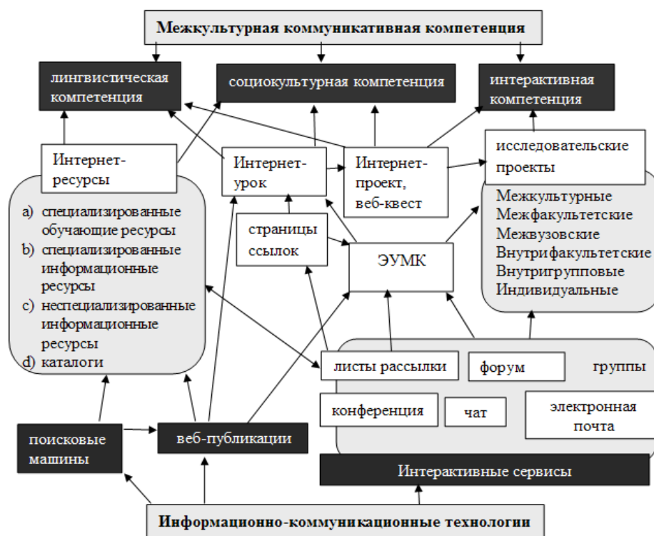
Рисунок 2 – Схема межкультурной коммуникативной компетенции

В образовательной среде МАОУ Чикчинской СОШ им. Якина активно применяются методы, способствующие улучшению межкультурного общения. Нарботанный опыт показывает, что важной основой для успешного взаимодействия в многонациональном классе является формирование толерантного отношения к культурным различиям и развитие навыков эффективного общения. Основное внимание уделяется практикам, которые расширяют понимание многообразия и позволяют учащимся глубже осознать свои культурные корни и культуру окружающих.